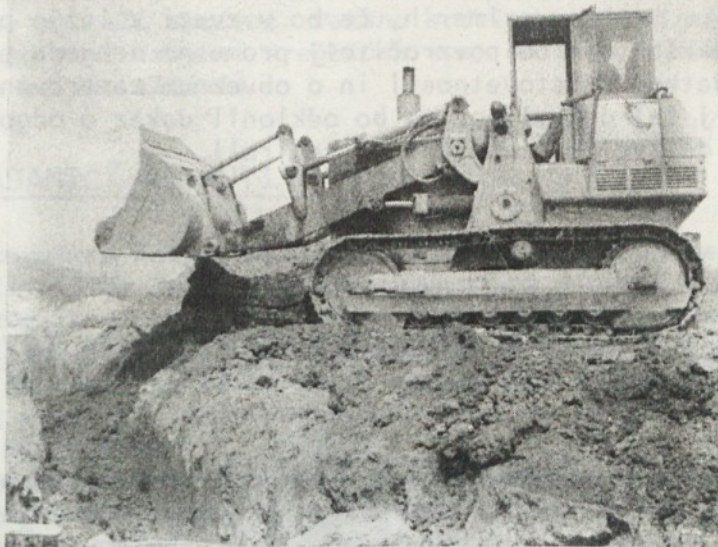
Gradnja komunalnih naprav v novem stanovanjskem predelu v Grosupljem (Jerova vas)

bo Komunalni sklad s prispevkom asfaltiral tudi vse stanovanjske ceste. Cene stavbnih parcel znašajo glede na komunalno opremljenost v Grosupljem okoli 120.000 din, v Ivančni gorici pa 60.000 din. V Ivančni gorici je v tej ceni vračunano zemljišče, izgradnja dovozne makadamske poti in transformator. Ostale komunalne naprave vodovod, kanalizacijo oz. greznice ter asfalt pa bodo morali zgraditi investitorji sami.