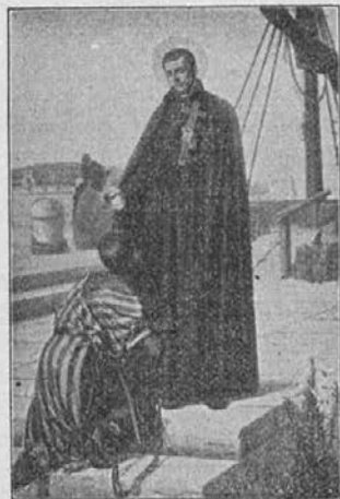
Sv. Peter Klaver, apostol zamorcev, prosi za uje in za naše podjetje!