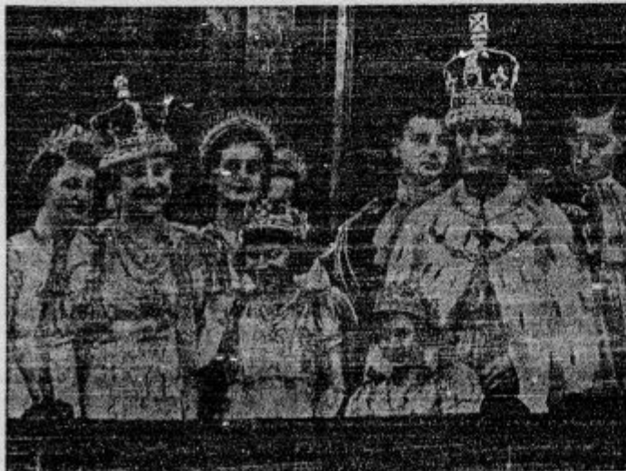
Angleška kraljevska družina v svečanih oblekah in s kronami na glavah se po kronanju zahvaljuje ogromnim množicam, ki jo pozdravljajo.

d Vesele Binkošti. Ljubljanski izletniki so imeli za letošnje binkoštno praznike res lepo srečo. Železniški promet je bil v soboto, nedeljo in v ponedeljek v Ljubljani prav ogromen. Samo na Gorenjsko je v soboto in nedeljo odpotovalo kakšnih 10.000 potnikov, v ponedeljek pa okoli 2000. Na Dolenjsko je odpotovalo v soboto in nedeljo okoli 5000 potnikov, v ponedeljek pa 1000. V Kamnik je odpotovalo v soboto in nedeljo okoli 1000 potnikov, v ponedeljek okoli 500. Velike pa so bile tudi ekskurzije v Italijo. Skozi Ljubljano je na Rakek in čez mejo iz Slovenije potovalo po železnici nad 3000 potnikov, ki so bili namenjeni deloma