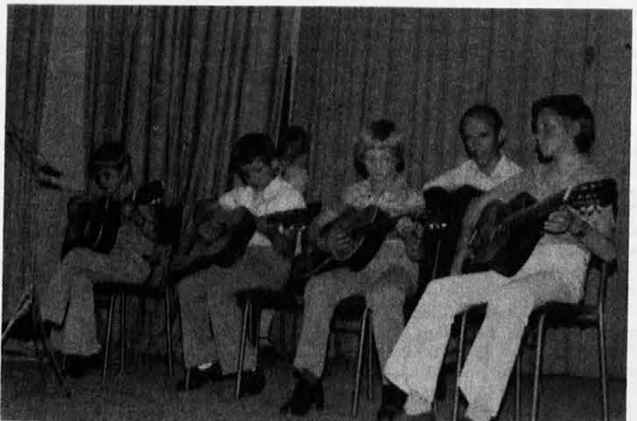
Mladi kitaristi na letošnji zaključni prireditvi glasbene šole v Štandrežu