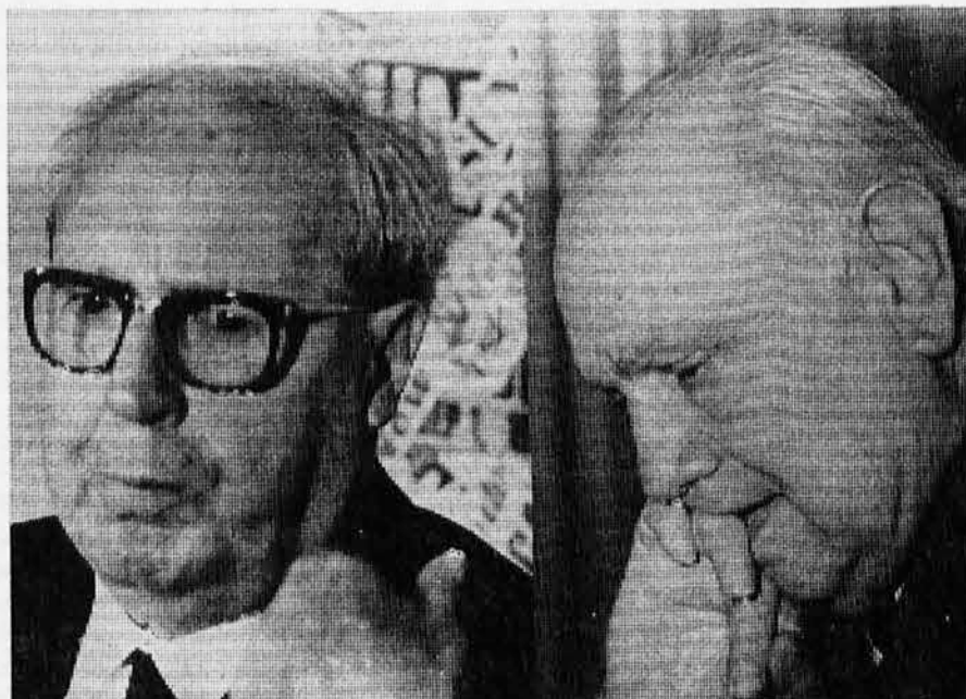
Resna obrazza Saragata (na levi) in De Martina (na desni) pričata, da Italijanskim socialistom na zadnjih volitvah ni šlo po njih željah. Saragatovi socialdemokrati so padli od 5,1% na 3,4, De Martinovi socialisti, ki zagovarjajo odprtje proti komunistom, pa so ostali na 9,6% glasov, premalo, da bi lahko sedaj vsiljevali svojo voljo ali se šli »levo alternativo«

Zato se deželno tajništvo Slovenske skupnosti novič iskreno zahvaljuje vsem podpisnikom, aktivistom in tradicionalnim ter novim volivcem v videmski pokrajini, ki so jo v tako izdatnem številu podprli na parlamentarnih volitvah in s tem potrdili njen narodnoobrambni in gospodarsko socialni program, kakor tudi vsem drugim volivcem socialističnega ali komunističnega prepričanja, ki so zlasti pri volitvah za senat volili za Slovensko skupnost.