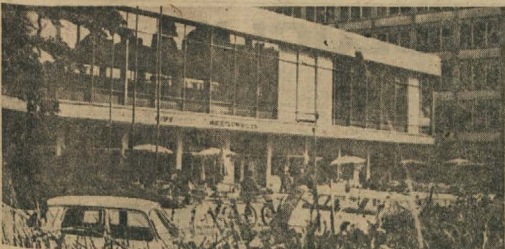
Samopostrežna restavracija bo za marsikoga drugi dom