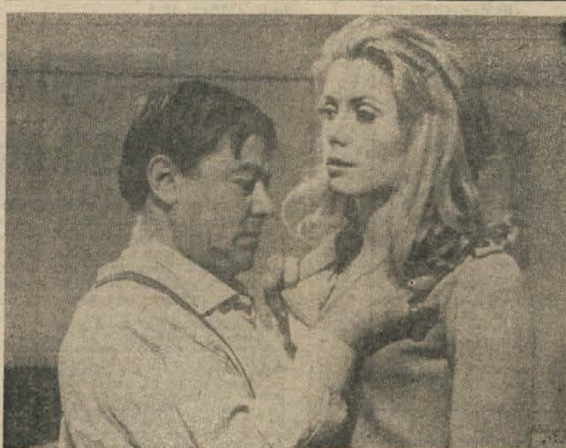
Catherine Deneuve v nagrajenem filmu Belle Jour.