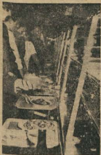
Tudi v vrsti ne bo treba tako dolgo stati

— vodstvo samopostrežne restavracije Center si je zadnja leta prizadevalo, da bi navezalo tesnejše stike s študenti, s študentsko organizacijo. Letos vse kaže, da se bodo ti naporu uresničili. Zakaj? Kolektiv samopostrežne restavracije predlaga, da bi