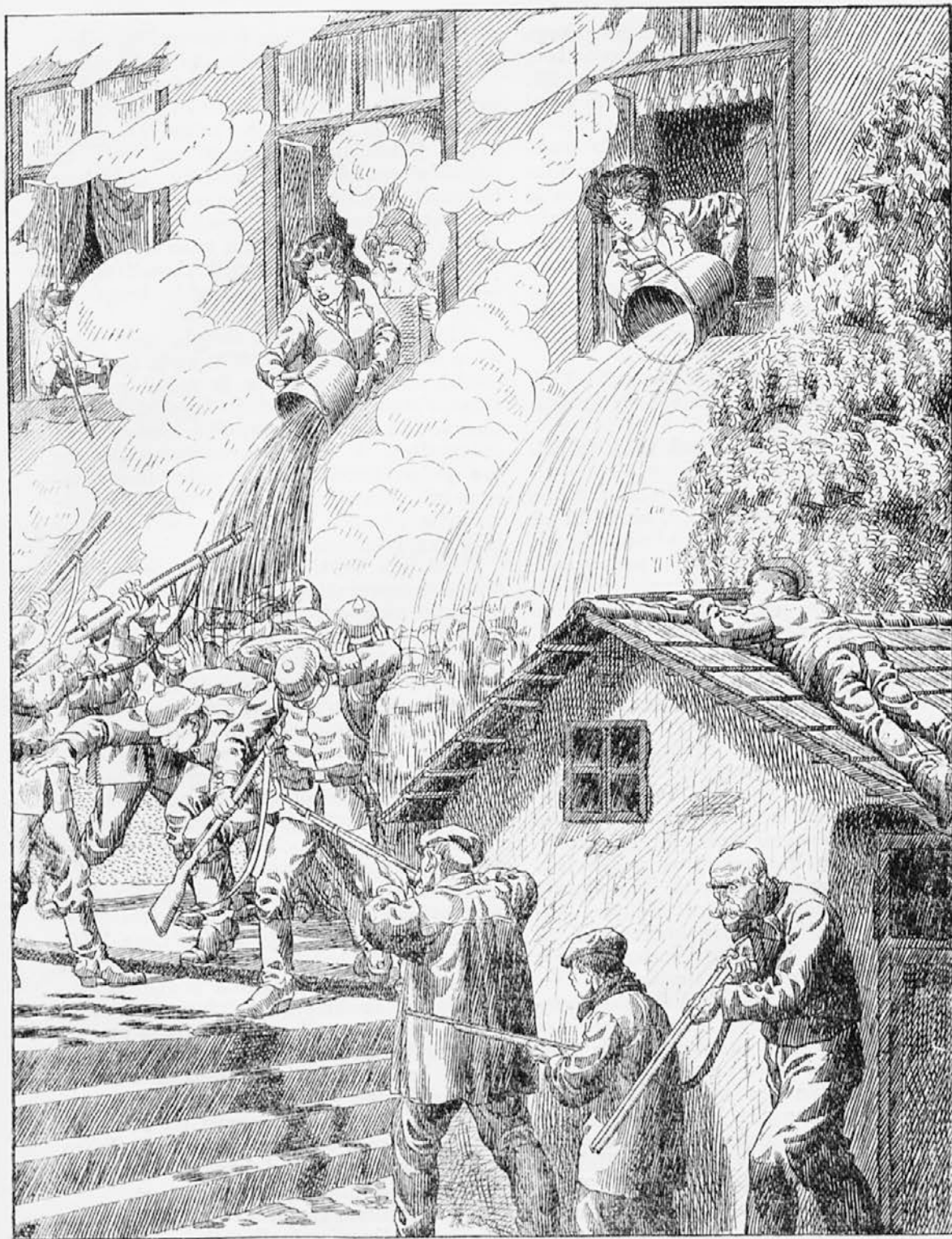
Kako je belgijsko prebivalstvo zavrtno napadlo nemške vojake.