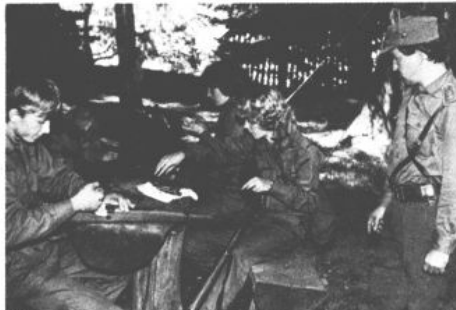
Čiščenje orožja niti ni tako slabo delo