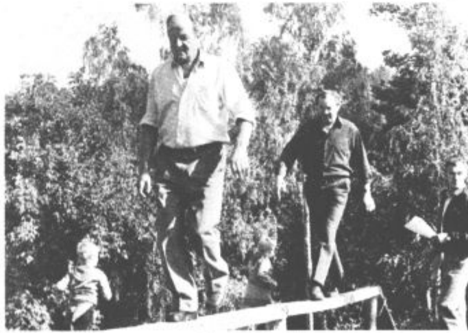
Zmagovalna ekipa KO ZRVS Center-levi breg