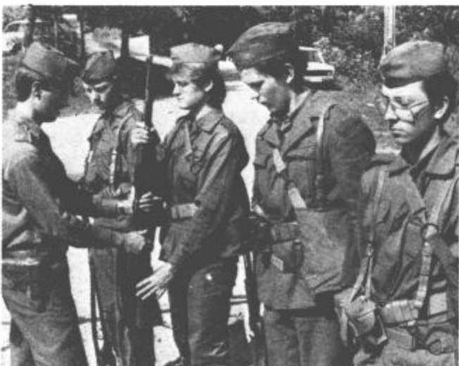
Orožje za pregled