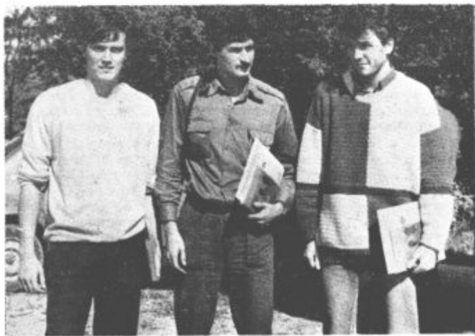
Ena od spretnostnih nalog je bila hoja po gredi