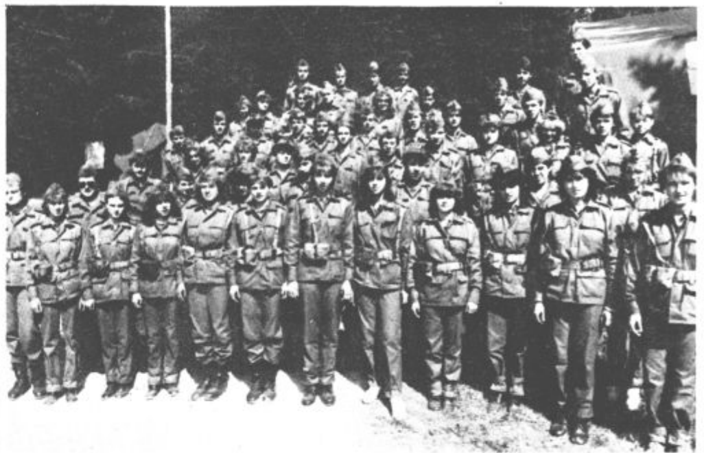
»Veliko smo se naučili«

Najbolj so se »pritoževali« nad zgodnjim vstajanjem. Ni pa jih motilo, da je bilo učenja res veliko: