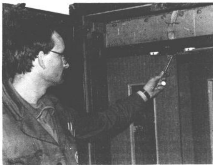
Le komu je vrata tako težko zapreti, da je prekinil kontakt?

Žal pa so s temi vrati v mnogih stanovanjskih stolpnih težave, saj jih je mnogim očitno pretežno zapirati. Tako je tudi na Jenkovi cesti v Titovem Velenju. Vzdrževalec je bil pred dnevi, ko je prišel na redno vzdrževanje, zares zelo neprijetno presenečen. Nekdo se