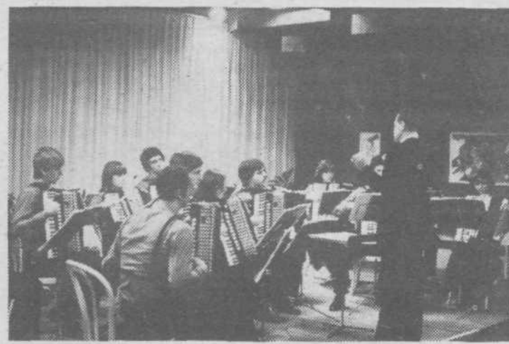
Harmonikarski orkester KUD Vide Pregarc