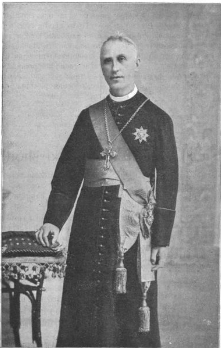
Dr. Josip Stadler, nadškof v Sarajevu.

8. Proti koncu se je na shodu govorilo tudi o medsebojnem razmerju družb in o udih, ki gredo iz kraja v kraj. Če v tem oziru ni reda in udje švigajo sempatja, ne da bi se kaj zglaševali, nastane velik nered. V tej zadevi se je držati tega, kakor predpisujejo