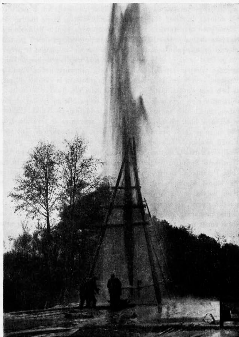
Izbruh slatine v Petanjcih 1906.

še precej časa, preden je mogel to ozemlje kupiti; nato se je šele začelo pravo delo. Trebalo je poizkušati na več krajih, da bi našli pravo in najbogatejšo