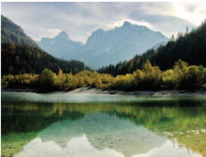
Gorsko ogledalo.