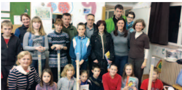
Obisk v Ljubljani predstavljen pri pouku.

Po ogledu predstave v Drami smo se podali še proti Cankarjevemu domu in večina učencev ni mogla skriti navdušenja, ko so se znašli v središču Gallusove dvo-