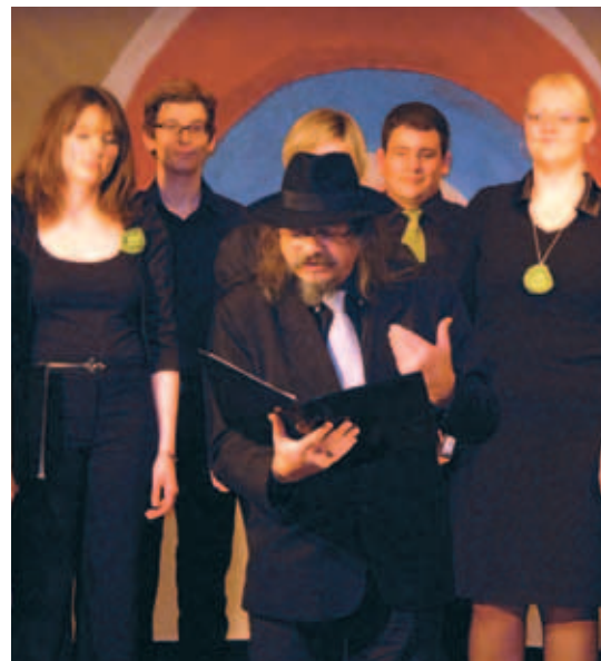
Z nastopa gostov.