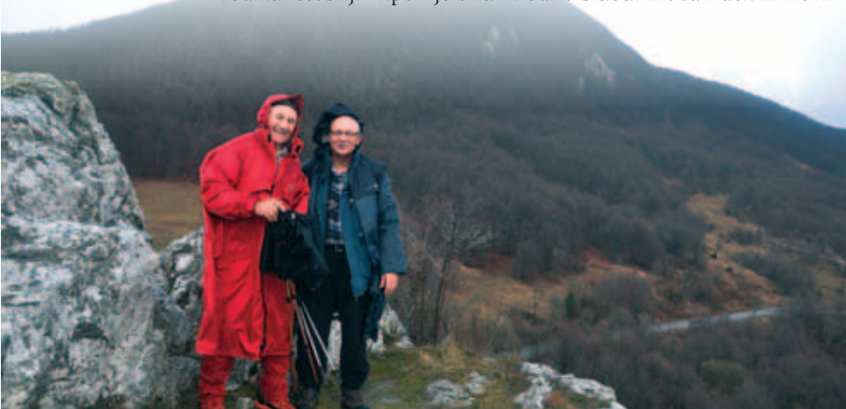
Na Korgu.

te z grmenjem. Natančne napovedi imajo tudi svojo slabo stran: planinci smo se pomehkužili, preberemo napoved, in če je mokra, se odpovemo vzponu. Tako so letos Kamenjakovci zaradi napovedi odpovedali avtobus. Mogoče je bilo tudi premalo prijavljenih in je bila napoved dober izgovor?