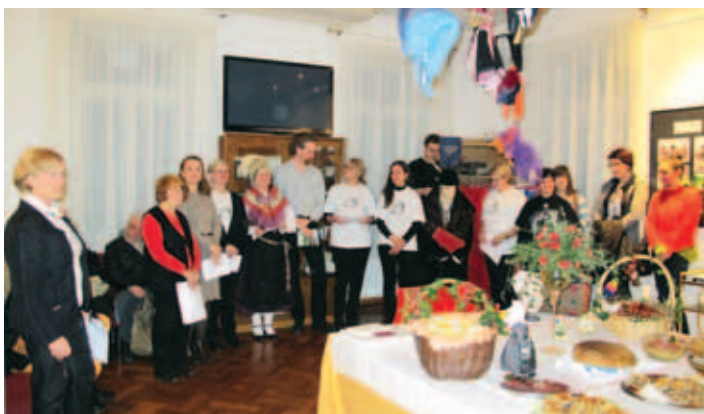
Razstava in nastop v KPD Bazovica.