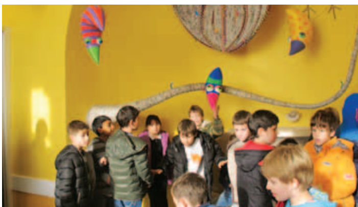
Igralnica.