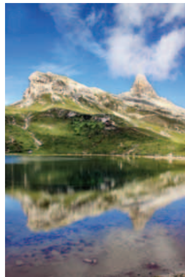
Zasvojena z modrino.