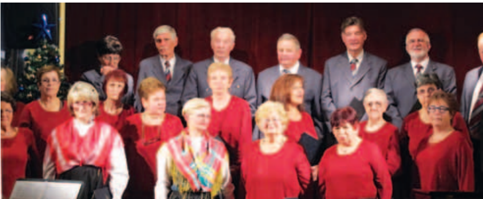
Z nastopa.

17. december, Slovenski dom KPD Bazovica