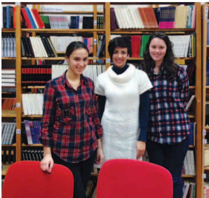
S predstavitev v Opatiji.