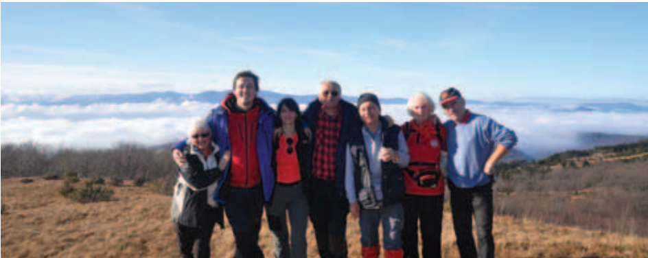
Na grebenu Pliši.

Skupina planincev je šla mimo naše male skupine, ki je na grebenu Pliši uživala v soncu in fotografirala meglice in oblake nad Kvarnerjem. Ko so šli mimo, se je najprej zaslišal ženski glas: "To je Bazovica!" Potem pa še moški glas: "Ja, ja, tisti stari je iz Bazovice."