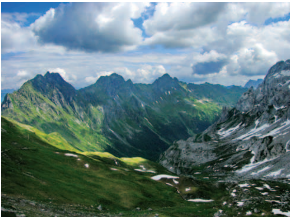
Passo Sesis.

6. december, Dolsko, Gradiškovo srečanje