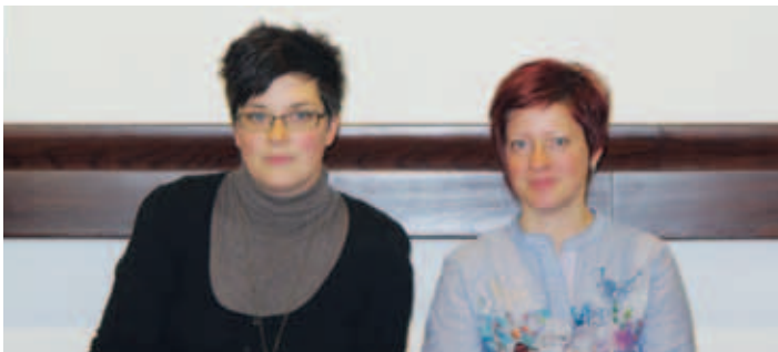
Mladi predstavnici KPD Bazovica.