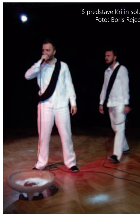
S predstave Kri in sol.