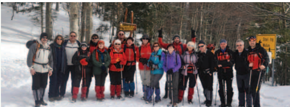
Zbor udeležencev.

Planinska skupina Bazovica veliko da na planinsko izobraževanje svojih članov. Tako je bil tudi letos organiziran tečaj hoje v zimskih razmerah, ki so ga s pomočjo PD Snežnik, lastnih vodnikov in gorskih reševalcev iz Ilirske Bistrice opravili na Sviščakih. Tečaja se je udeležilo 12 članov. Vodje tečaja (gorski reševalci Vlado, Marko in Damjan ter vodnika planinske skupine Bazovice Andrej in Damjan) so se letos odločili za vajo hoje z derezami, prečenja strmih pobočij in zaustavljanja