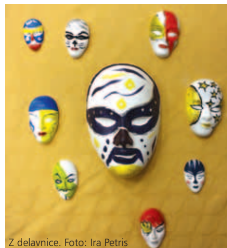
Z delavnice.