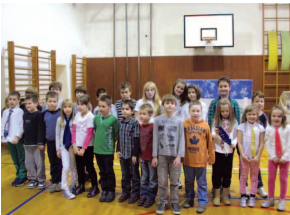
Skupina učencev slovenščine.