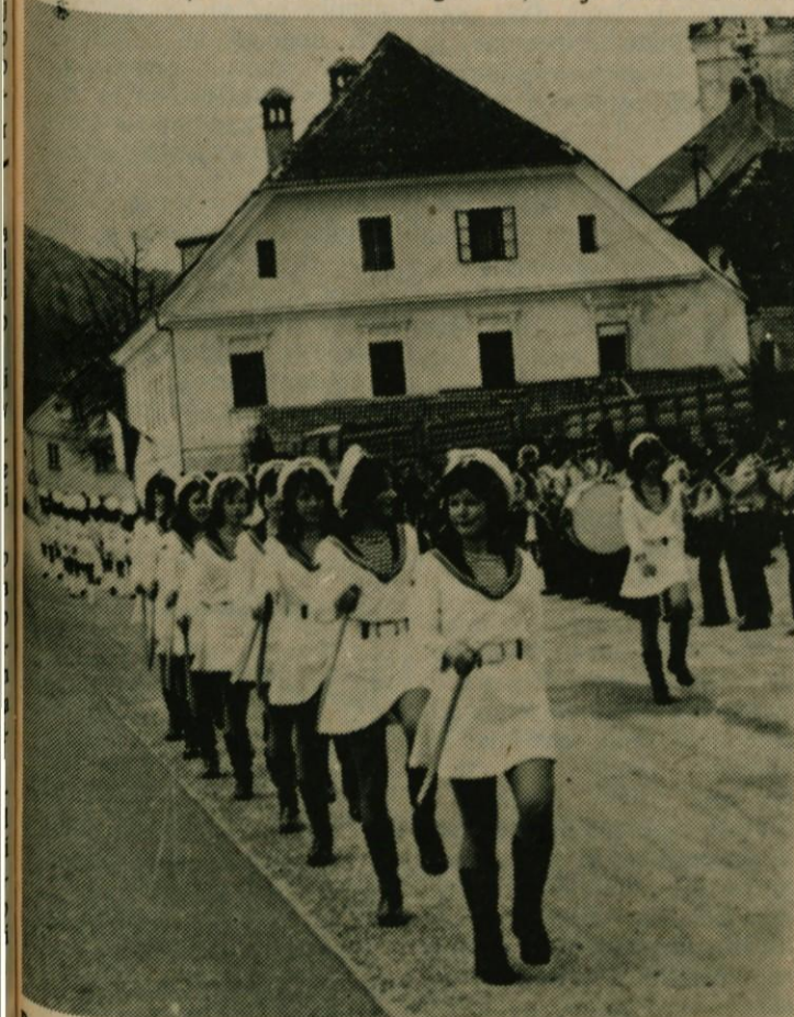
Prvega maja so učenci glasbene šole priredili občanom zanimiv priložnostni koncert. Ob tej priliki so dekleta izvedle zanimivo točko z bobni.

28., 29. VI. ameriški barvni vestern DOC HOLLIDAY