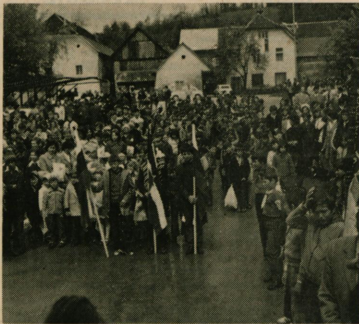
Sprejem pionirskega pohoda po poteh IX. korpusa v Dolenjem Logatcu se je udeležilo mnogo ljudi.

Mladina, pionirji, taborniki, borci in rezervni starešine logaške občine so se dobro pripravili za udeležbo pri pohodu po poteh slavnega IX. korpusa. Že zarana 5. maja so odšli v Planino pri Rakeku, kjer so jih pred spomenikom padlim borcem že čakali številni mladinci in mladinke, pionirji, taborniki, predstavniki postojnske občine in prebivalci Planine. Po prijetnem kulturnem programu pred spomenikom so prevzeli nadaljevanje poti logaški udeleženci tega pohoda. Pot jih je najprej