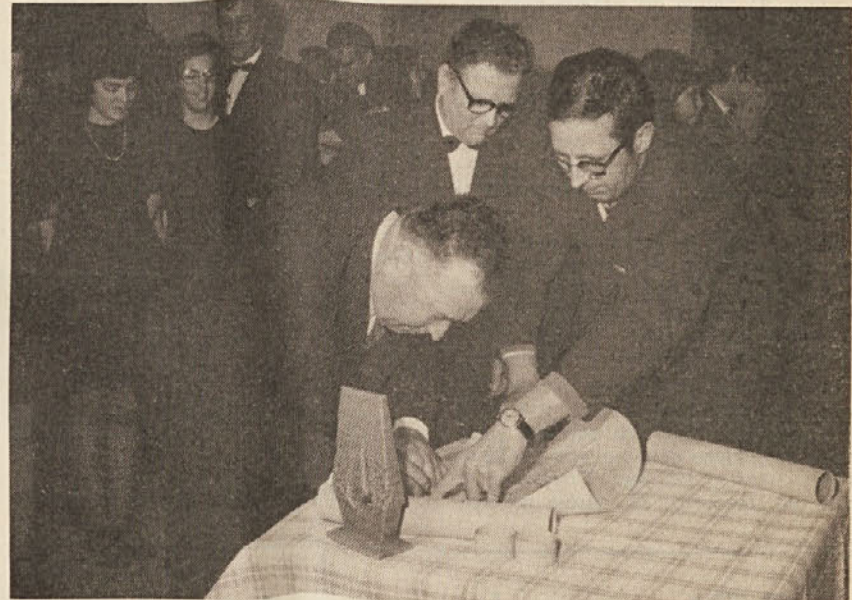
Podpis listine o pobratenu.

V nedeljo 12. marca sta se pobratili prosvetni društvi Primorec iz Trebč in Svoboda iz Pridvora pri Kopru. Priložnostna svečanost je bila v Prosvetnem domu v Pridvoru. Po uradnem delu svečanosti je bil koncert pevskega zbora Primorec in godbe na pihala iz Pridvora. Trebč so navezale stike s Pridvorom že lani. Na slavlju ob 25-letnici postavitve spomenika padlim v NOB je v Trebčah nastopila godba iz Pridvora. Takrat so se domenili o nadaljnjem sodelovanju. Kasneje pa je prišla iz Pridvora pobuda za pobratenje, katero so Trebenci sprejeli. Sicer pa je tudi nedavna zgodovina Trebč v marsičem podobna zgodovini Pridvora. Oba kraja sta mnogo pretrpela pod fa-