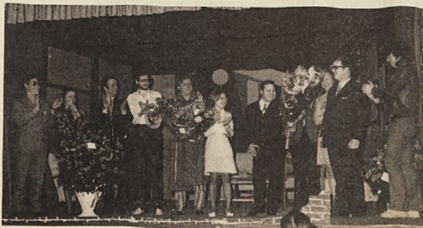
Igralci Slovenskega amaterskega gledališča.