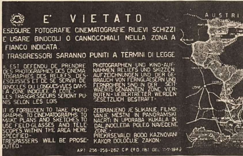
Opozorilne table na področju vojaških služnosti.

Dokler bo naši deželi pretila nevarnost atomskih min — nesmisel, saj meji na nevtralni deželi — se ne moremo čutiti varni.