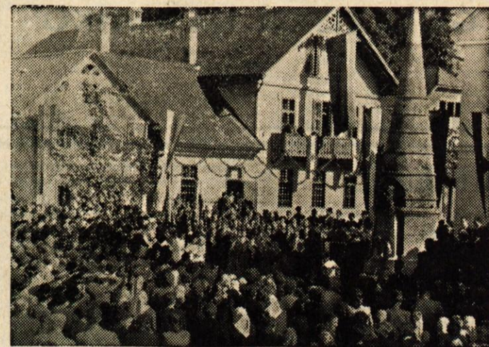
Pred spomenikom Davorina Jenka v Cerkljah se je v nedeljo zbrala velika množica ljudi

delo. Jenkove skladbe preveva vera in ljubezen do rodne zemlje in prav zaradi tega so tako priljubljene in jih tako radi poslušamo. Davorin Jenko pa ni samo slovenski skladatelj. Do-