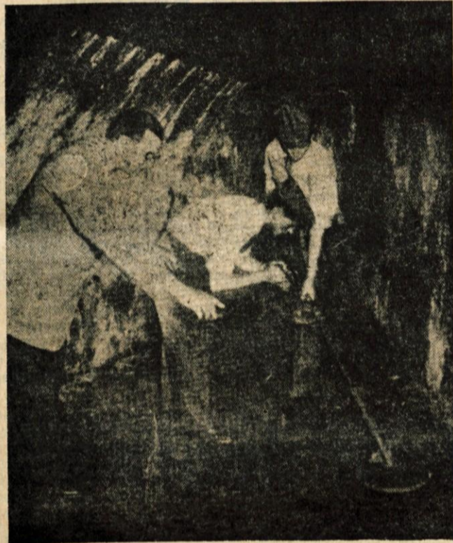
Raziskovanje elsinorskega podzemlja

Napis iz Elizabetinih časov na Shakespeareovem nago- bnem spomeniku je že zdavnaj zanimal številne strokovnjake, kajti še danes so prepričani, da je verze sestavil pesnik sam in nekaj dni pred