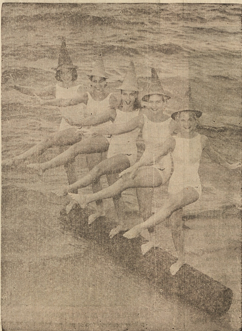
PRI IGRI DEKLET — Mladost je lepa in polna veselja. Mlada dekleta na morskici peščini Floride preskušajo v igri svojo spretnost v ravnotežju stoječ na hlođu.

Zidana 4-družinska hiša, se lahko preuredi za 6 družin. Dober dohodek. Vse v dobrem stanju, nov cementni dovoz, bakrene cevi, plinski furnezi, dobra streha, klet itd., v fari sv. Vida. Lastnik se mora seliti. Kličite HE 1-3662 ali EN 1-6020 za sestanek. (7,12,14,19,21 apr.)