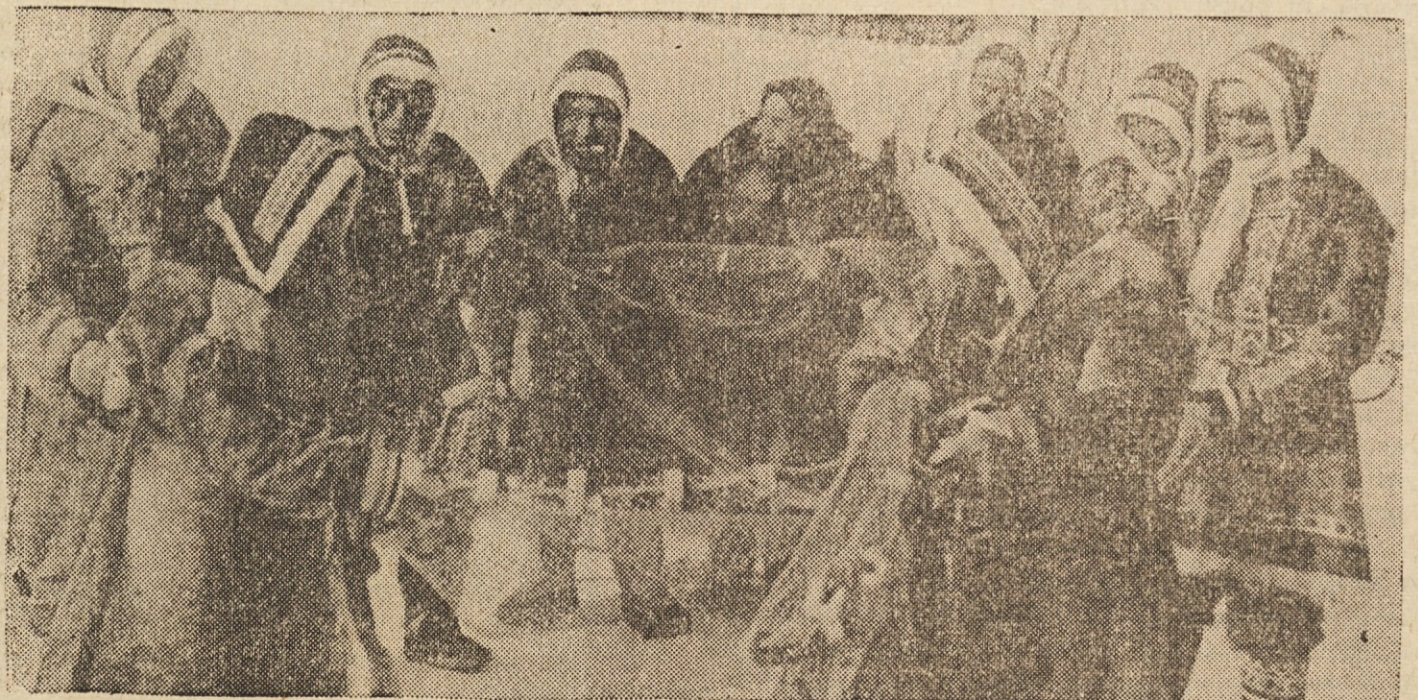
MRIZ IN LED NAJHUŠA NADLOGA — Na polotoku Tajmir na skrajnem severnem robu Sibirije ni nikdar posebno toplo, pač pa kaže toplomer velikokrat tudi 50 in več pod ničlo. Tamkajšnji ribiči morajo do- stikrat tudi še v pomladi sekati luknje v led, da morejo z mrežami v morje po ribe. Slika kaže skupino taj- mirskih ribičev.