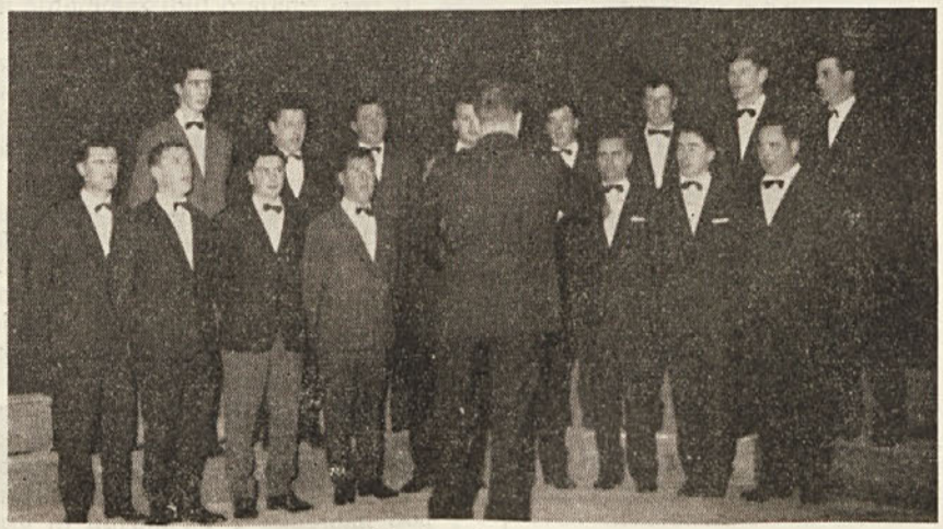
Moški pevski zbor iz Velikega Repna