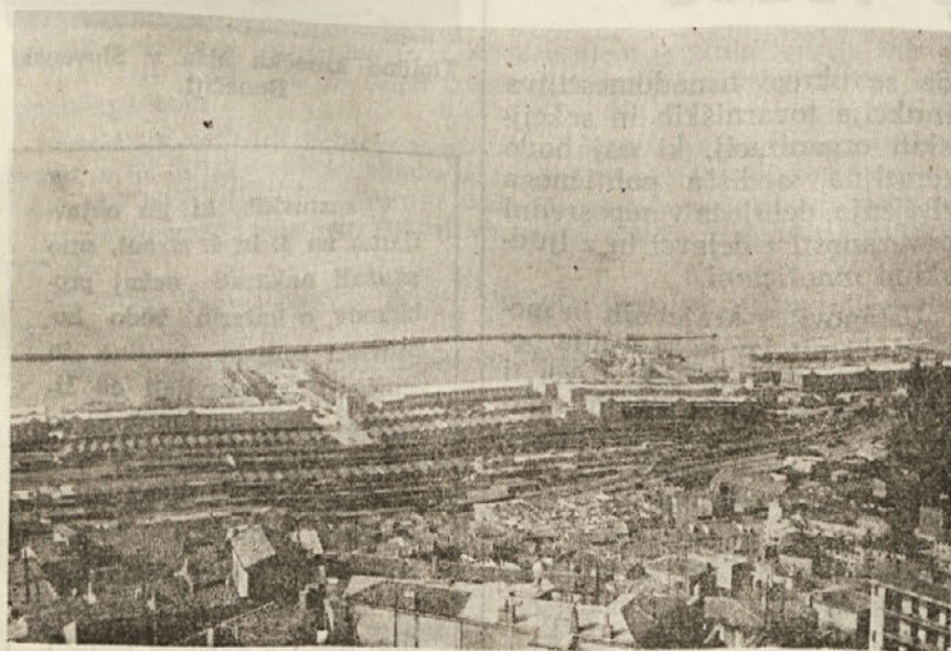
Tržaško pristanišče je bilo nekoč eno največjih v Sredozemlju, danes ni več niti med prvimi italijanskimi pristanišči. Zgrešena vladna politika mu onemogoča, da bi vršilo vlogo posredovavca med Podonavjem in Prekomorjem. Z ustanovitvijo dežele Furlanija-Julijska krajina se tudi Trstu odpirajo boljše perspektive

K izboljšanju teh odnosov so dali svoj prispevek tudi obiski delegacij Komunistične partije Italije v Sloveniji in Zveze komunistov Slovenije v naši deželi, ki so si sledili v zadnjih letih.