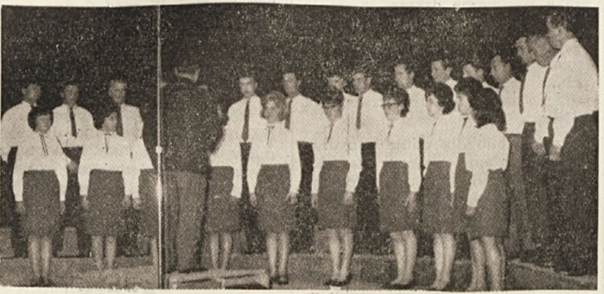
Pevski zbor iz Steverjana pri Gorici