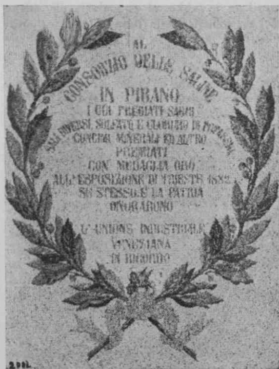
Diploma zlate medalje na mednarodni razstavi v Trstu l. 1882

resnica.« 12 Že v prvem odstavku tega člena srečamo gospodarja in gospoda solarn. Da ustreza pojem gospodar resnično privatno-pravnemu pojmu gospodarja, ni nobenega dvoma. Znane so nam družine, ki so v koprskih solarinah imele svoje privatne posesti, svoje lastne solne fonde. Naj omenimo samo družine Gravisi, Madonizza, Tacco, Vergerio ter samostane očetov kapucinov, Sv. Ane in Sv. Gregorja. Toliko o gospodarju ali padronu. Gospod ali dominus pa nima nič skupnega s privatno posestjo, temveč je uradnik, ki ga imenuje občina, da pazi in gleda na občinske solne fonde. Nekaj podobnega smo zasledili v Izoli. Toda medtem ko izolanska občina prodaja svoje solne fonde za določeno dobo privatnikom, je koprška občina na soli bolj zainteresirana in si pridržuje pravico do lastnega pridelka. Mora pa zato imeti delavce in imenovati uradnika, ki skrbi, da so njene solarne dobro oskrbovane in obdelane, da se pravočasno začne z delom in pridobivanjem pridelka. Poleg tega je »dominus« tudi kontrolni organ vseh občinskih solarn, saj noben solar ne sme začeti s pridobivanjem soli, ne da bi mu prej prijavil točen dan. To je občini Koper povečalo dohodke, saj je s ceneno delovno silo na svojih solnih fondih prišla do lastnega pridelka, s kontrolo privatnih fondov