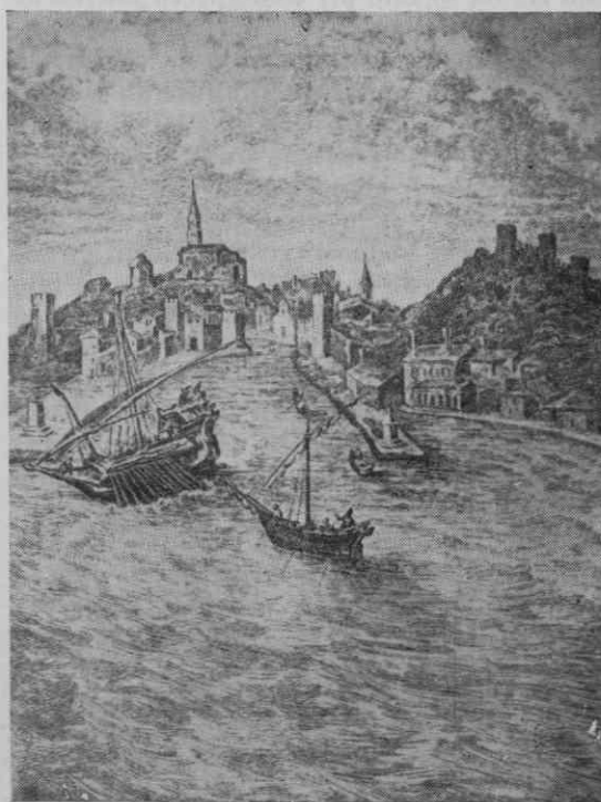
Piran s pristaniščem v XVI. stoletju. Bakrorez po sliki Domenica Tintoretta