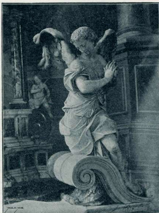
Izklesal Fr. Robba.

FRANC. ROBBA. VEN. INVEN. ET. FAC. 1732.