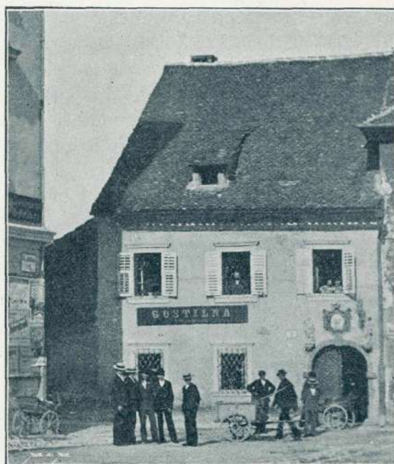
Robbova hiša v Ljubljani, pozneje gostilna „Prešernov hram“ na trgu sv. Jakoba, po potresu porušena.

Robba je plačeval za tisto dōbo precej davka. L. 1726. so mu odmerili 8 gld. 10 kr., dočim so drugi kiparji -gostači plačevali le 4 gld. 10 kr. Pozneje je plačeval kot hišni