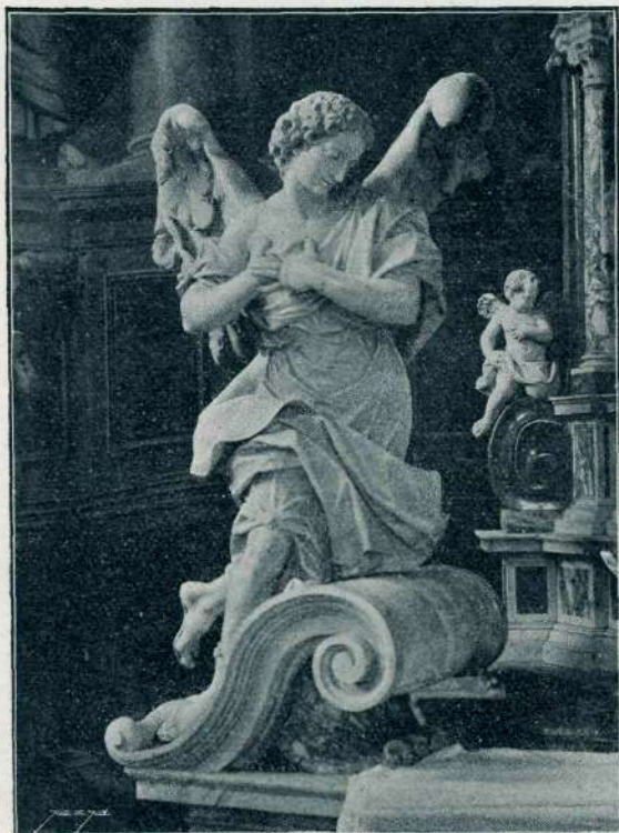
Izklesal Fr. Robba.

2. Kip Karola VI. — Cesar Karol VI. je nastopil vlado že l. 1711. in bi torej moral priti tudi v Ljubljano k poklonstvu; vojne z Ludovikom XIV., nasledstvena vojska in