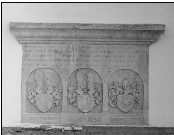
Heraldična plošča nad vhodnim portalom gradu Fužine

rival trgovske družbe Khisl-Weilhamer, saj se zaradi svoje silne podjetnosti ni oziral na izključno pravico, ki jo je imela ta družba za izvoz samoborskega surovega bakra in je s tem izzval spor. 52