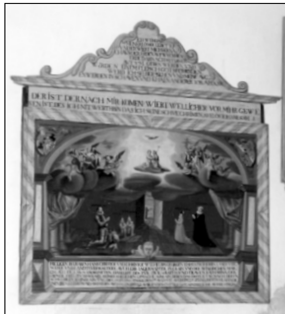
Nagrobna slika družine Khisl iz leta 1598 v cerkvi sv. Elizabete v Podrebri.

O Jurijevi družini priča kar nekaj ohranjenih materialnih ostankov.