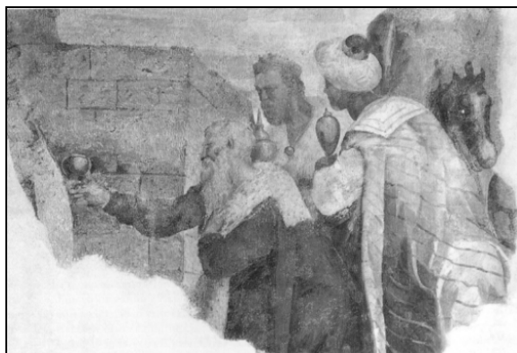
Ostane poslikave v grajski kapeli na družinskem gradu (Umetnost na Slovenskem, str. 37)