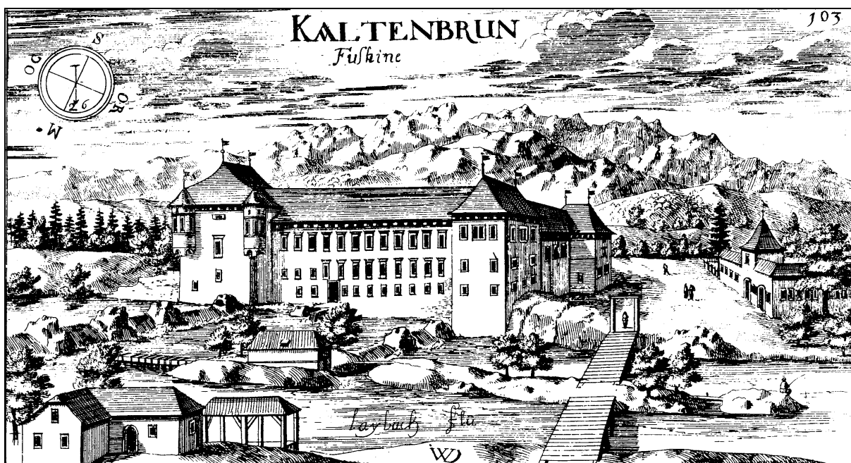
Grad Fužine (Valvasor, Topographia , fol. 103)

let brez dajatev, nista pa smela postaviti jezusa. Leta 1530 sta ob Ljubljani v kraju Fužine 46 postavila tudi železarno oziroma manufakturno podjetje, za delo pa najela 15 strokovnih delavcev – mojstrov iz Italije. Podjetje je izdelovalo različno orožje in topovske krogle za ugledne naročnike, med katere je sodil tudi neapeljski kralj. 47 Tudi sicer sta krogle prek Reke izvažala v Italijo. Že istega leta sta prosila za dovoljenje za izvoz 500 krogel v Bari. Obrat sta nameravala še izpopolniti za izdelovanje medenine, zato sta zaprosila za privilegij, da bi bila nekaj časa oproščena dajatev in bi na ta način krila stroške investicije. Poleg železarne so bile tu tudi fužine bakra (1529), ki ga je družba prodajala na Reko, in topilnica svinca v Litiji. 48 Drva, ki sta jih potrebovala, so obrati dobivali iz deželnokežjega štangarskega gozda. O velikih množinah bakra, ki so najverjetneje prišle iz Samobora, govori tudi podatek, ki ga najdemo v registru ljubljanskega nakladniškega urada iz leta 1544, kjer se omenja transport 17.803 funtov bakra za družbo Khisl-Weilhamer. Od tega naj bi Vid prepeljal okoli 8.500 funtov bakra, 49 Weilhamer pa še več (9.300