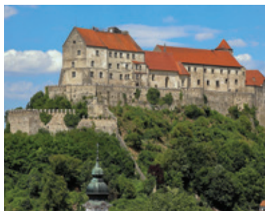
Grad Burghausen, podružnica koncentracijskega taborišča Dachau