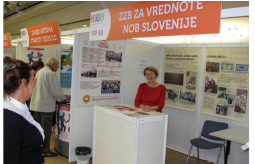
ZZB NOB Slovenije vsako leto sodeluje na Festivalu.

Na letošnjem festivalu, ki bo v ljubljanskem Cankarjevem domu od 1. do 3. oktobra, bo naša organizacija sodelovala tako kot že vsako leto do zdaj. Tokratno vsebino smo posvetili kulturi, njenemu vplivu in kulturnim dejavnostim pri nas v okviru NOB. Vse to bodo prikazali plakati na našem razstavnem prostoru. Tu bodo kot vedno na voljo naš časopis Svobodna beseda, pa tudi nekaj drugih publikacij in obvestil o dogodkih, ki prihajajo.