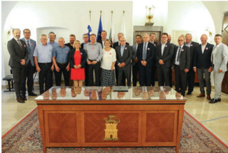
Podpisniki Sporazuma o sodelovanju pri skupnem projektu kandidature Mestne občine Ljubljana za naziv Evropska prestolnica kulture 2025.

Ena izmed zavez sporazuma je, da bodo, če bo Ljubljana izbrana