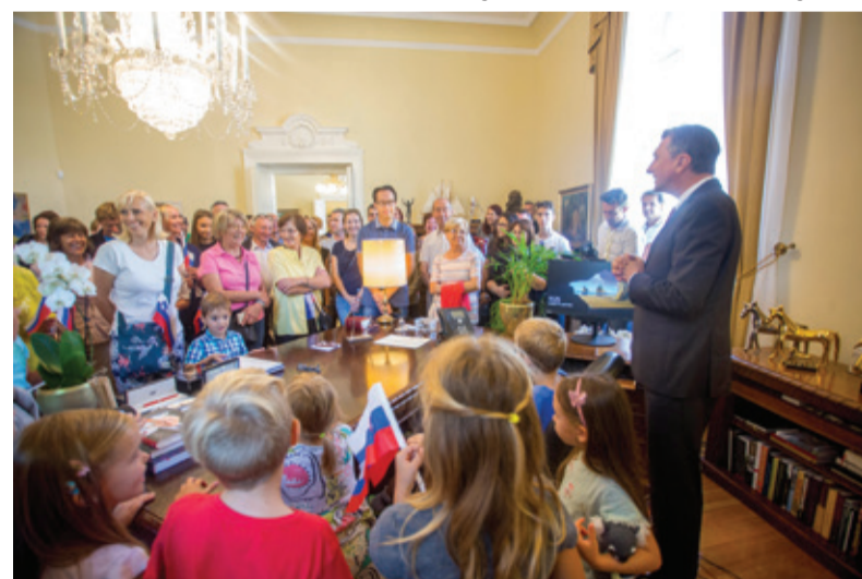
Pisarna predsednika Republike Slovenije