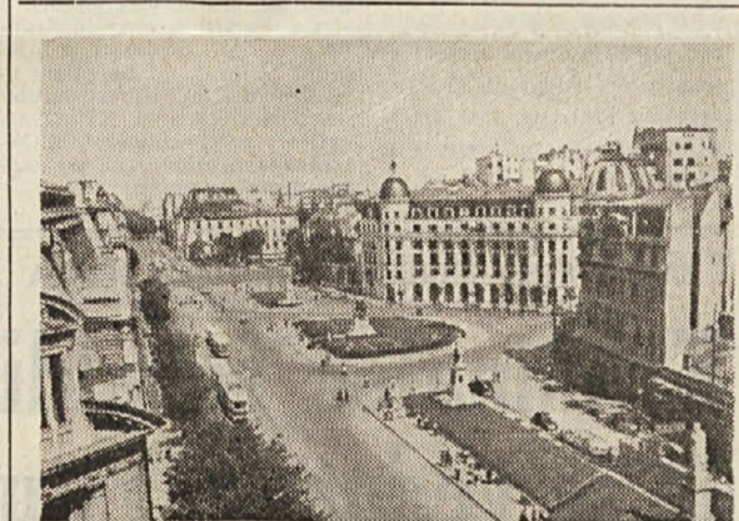
Univerzitetni trg v Burešči.

zročilo v zdravniških krogih pravo senzacijo. Eden izmed dvojčkov je prišel namreč na svet 16. decembra 1952, dočim se je drugi rodil šele 10. februarja 1953, to je 56 dni pozneje. Doslej je znan samo en sličen primer in sicer iz leta 1880, na Irskem. Razlika rojstva med prvimi in drugim dojenčkom je znašala trikrat 44 dni.