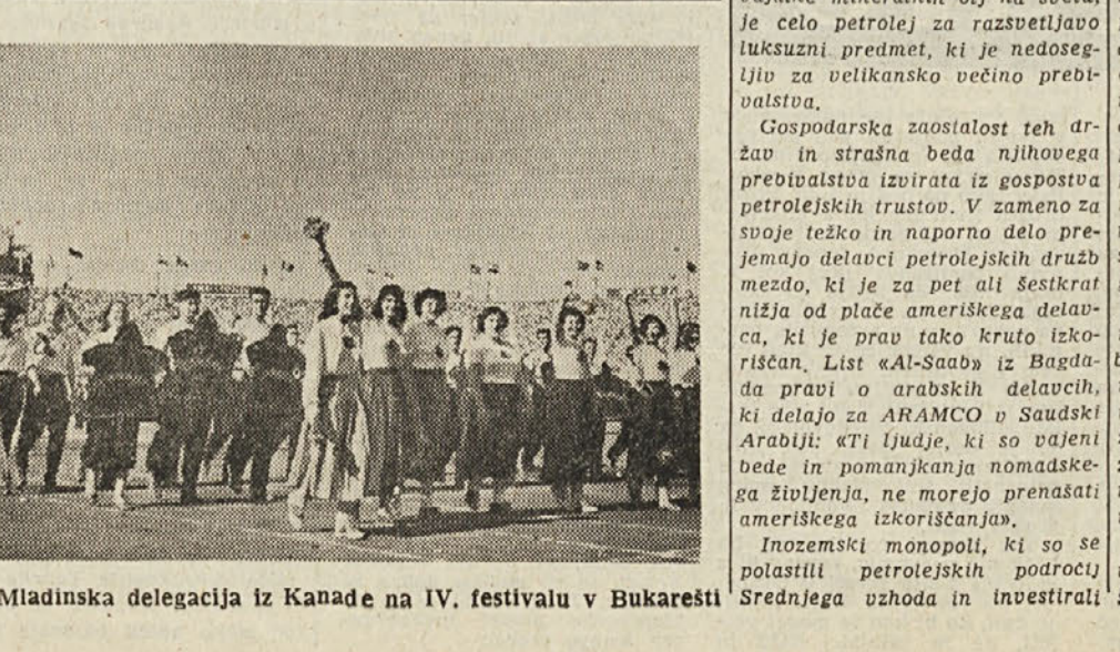
Mladinska delegacija iz Kanade na IV. festivalu v Bukarešti

Radio Trst II. je pred oddajalno vest, da bodo v gljisi 15. avgustom ukiniti kaznine na nekatere predmeti Radio je poudarjal, da je gleško prebivalstvo splošno z veseljem, ki je bilo renjeno iz del dejstva, da imajo istočasno najvišje plače bodo cene teh predmetov znatno povišale. Radio Trst II. vedno svedča toliko svojega »dragega« časa propagandni kotih v vzhodnih deželah. Ne vladajo ameriško-angliski vojski za ukinitve kazni nekaterih predmetov, ki je prodaja vrstnih proizvodov še vedno »črna«? Zakaj ne pere javnosti umazane cene gospodarjev in omejuje je laži o neobstoju dejstva v deželah Vzhoda? Nekaj jektivnosti bi zelo prišlo radiu Trst II.