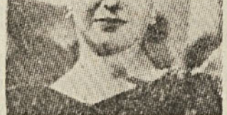
Sovjetska filmska igralka Ala Larina

Pomenbna novost za letošnji filmski razstavo je ideleža Sovjetske zveze, ki je bila že več let odsotna in gotovo ne po lastni krivdi. Prisotnost sovjetske filmske umetnosti na letošnjem festivalu je nedvomno varen in pomemben prispevek k