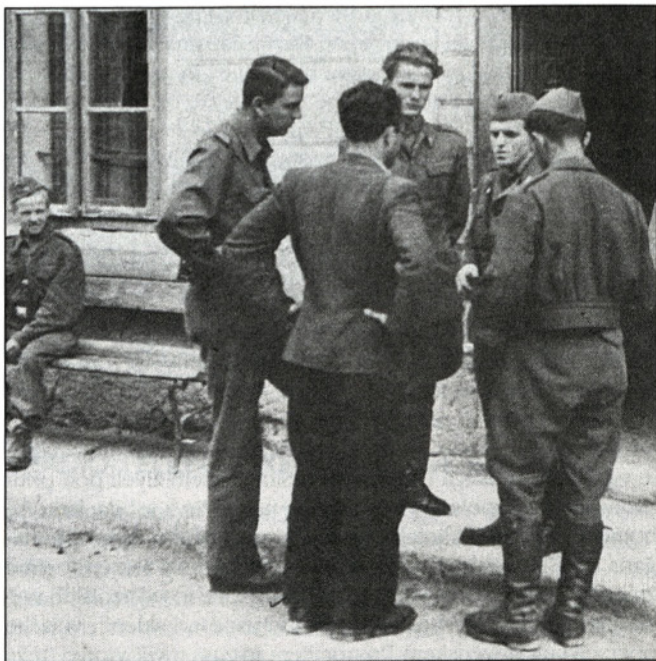
Komandant Stane v sproščenem pogovoru z zavezniškim oficirjem

Preráščanje partizanstva v redno vojsko pa je terjalo izkušnost, poznavanje obeh oblik vojevanja ter hkrati instinkt partizana in vojaka redne vojske. Zahtevalo je domiselno kombinatoriko partizanske strategije in taktike s strategijo in taktiko redne vojske, od partizanske diverzije, zasedb in bliskovitih napadov ter umikov do frontalnih napadov z vsemi rodovi vojske. Še več: zahtevalo je postopno ukinitve ‚partizanščine‘, negativnih strani partizanstva, predvsem prevelike samostojnosti in nepovezanosti