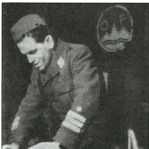
Redek prizor – komandant Stane kot govornik

Hkrati z razsežnostjo vojaškega delovanja v času NOB so rastle tudi poveljniške sposobnosti Franca Rozmana - Staneta. Ve se, da mora višji oziroma najvišji komandant vedeti in poznati, kako se bo razvijalo delo do zadnjega osnovnega vojaka, kadar se izda takšno ali drugačno povelje. Za komandanta Staneta je bilo to lahko, saj je preizkusil in poznal vse po vrsti. Na praktičnem znanju temelječe poveljevanje, najbolje usklajeno in pravilno povezano, je Rozmana pripeljalo do uspehov in zmag z najmanjšimi izgubami. Vedel je, kaj se dogaja na bojišču in kako je treba ravnati v manjših epizodah, v delnih večjih dogajanjih na bojnih prizoriščih ter v posameznih bojih, ki sestavljajo celoto. Kako naj ravna, kadar ima na voljo manjšo moč ali kadar ima relativno, začasno premoč. Mojstrstvo partizanskega vojevanja in tudi mojstrstvo regularne, redne vojske normalno temelji na istih načelih in zakonitostih vojevanja: spreminjajo se le okviri in kakovost sredstev. Iz partizanstva je bojevanje preraščalo v bolj strnjene, močnejše in večje enote, sposobne za premagovanje močnejšega sovražnika. Sposobnost poveljnika raste z nalogami oziroma z delom, za kar je prav komandant Stane izredno pozitiven zgled. Tako general Jaka Avšič.