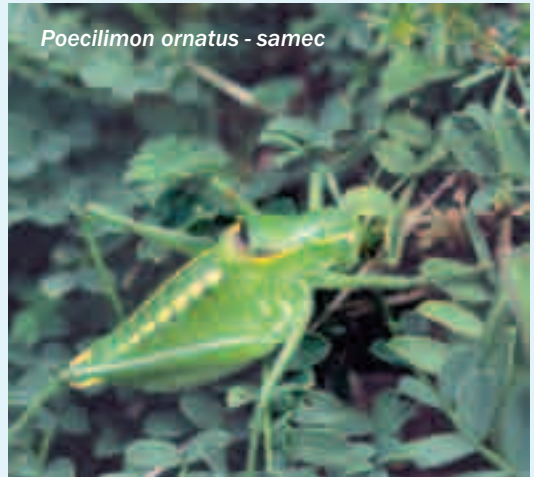
Poecilimon ornatus - samec

V spominu ostanejo zvoki oglašanja krokarja med prepadnimi stenami ali vreščanje plinarske kavke. Drobno cvrkutanje dolgorepk ali pretanjeno oglašanje ognjeglavčkov in žuborenje majhnega potočka dajejo doživljanju gorske narave poseben čar. Toliko je različnih zvokov,