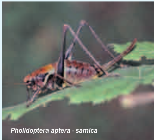
Pholidoptera aptera - samica

precej pogosta dolgotipalčnica, ki jo srečamo v gorah tja do višine prek 2000 m. Zanimivo je, da živi tudi v nižinah, prav pogosta je na Primorskem. Ima izrazito čokato, do 30 mm veliko telo. Če samčka primemo ali ga dražimo, se jezno oglašja in počasi odskaklja proč. Pholidoptera aptera je dolgotipalčnica gozdov od nadmorske višine 700 m pa vse do gozdne meje. Zelo rada se oglašja na kakšni jasi. Samčka slišimo nekaj deset metrov daleč. Vse predstav-