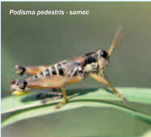
Podisma pedestris - samec