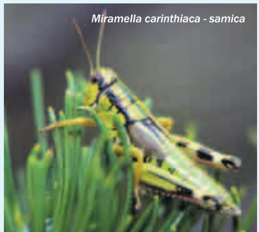
Miramella carinthiaca - samica

da smo včasih kar zmedeni, kdo neki se spet oglašja. Tudi če zapuščamo zadnje borovce in macesne in so pred nami že skoraj same skale, le tu pa tam je še zaplata borne trave in drobna cvetlica, lahko še vedno prisluhnemo komaj slišnemu cvrčanju kobilic, ki so si izbojevale živ-