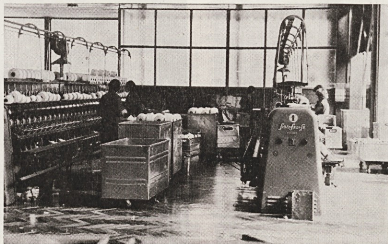
S preselitvijo šivalnice je pripravljavnica dobila večji prostor.