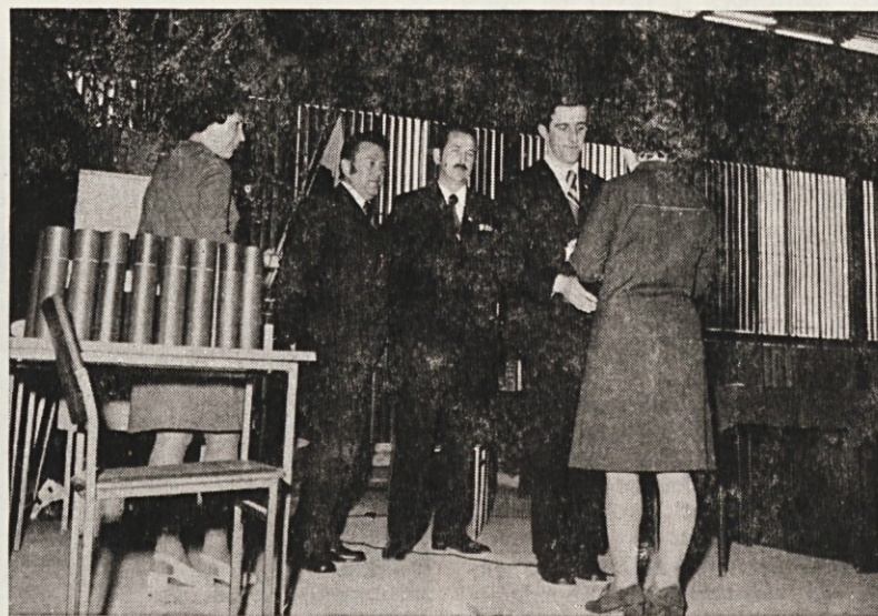
Predsednik DS izroča delavcem nagrade in priznanja

Delegat bo lahko uspešno opravljal svojo samoupravno funkcijo v vseh predstavniških telesih le tedaj, če se bo za zadeve zanimal, da bo o problemih razpravljal z delavci, si pridobil njihovo mnenje in stališče ter da bo vsestransko informiran. To