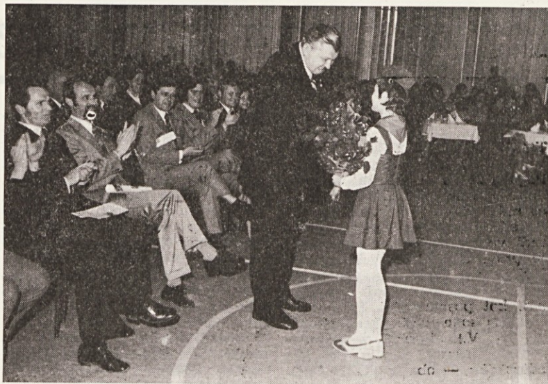
Občinski funkcionarji na tovarniški proslavi.

Ob tej priliki želim poudariti, da je ena od osnovnih nalog kolektiva, racionalno trošenje sred-