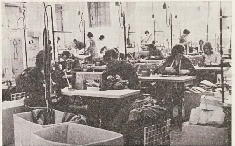
Konfekcija frotirja v novi hali.

Lokacija diesel električnega agregata bo v aneksu na južni strani kotlovnice. Vrednost investicije pa bo preko en milijon dinarjev. Cena kilovatne ure proizvedene doma bo približno trikratna današnje, zato bo ta agregat obratoval samo v nujnih primerih.