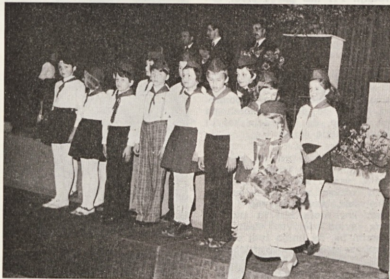
Pionirji mekinjske šole čestitajo delavcem na tovarniški proslavi.

Ob tej priliki smo obiskali tudi rojstno hišo velikega slovenskega pisatelja Ivana Tavčarja. Ob Sori so si udeleženci ekskurzije organizirali kratek piknik in tako združili prijetno s koristnim.