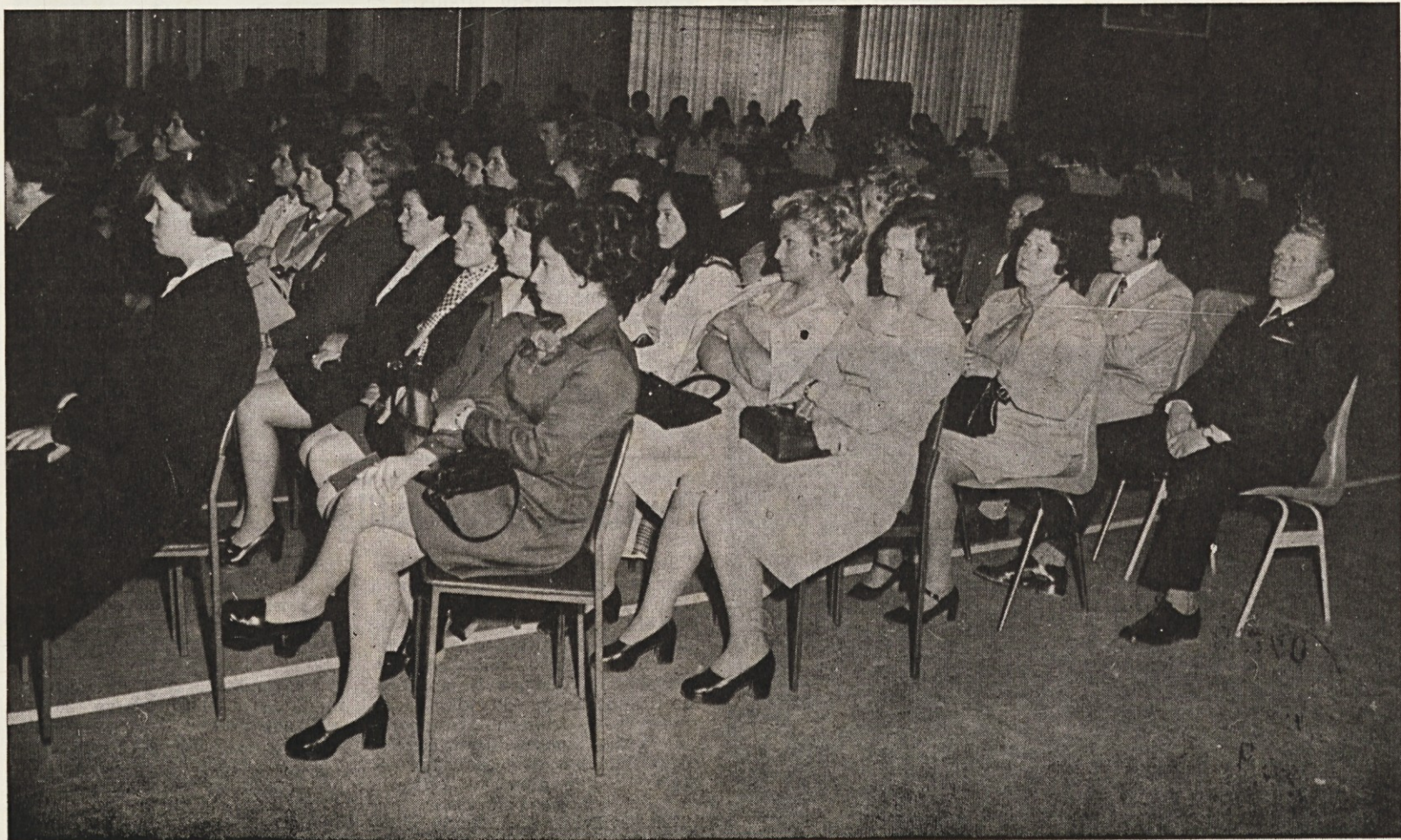
Iz jubilejne proslave »Svilanita« v dvorani Komunalnega centra Domžale.