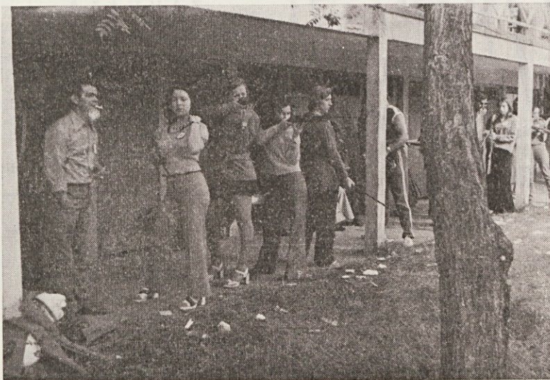
Naši strelci na tekmovanju v Subotici.