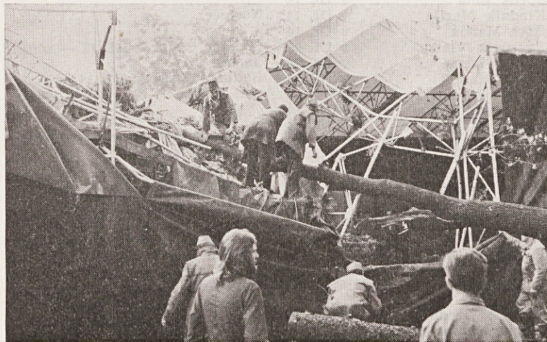
Upostojenje po viharju na Koridorju.