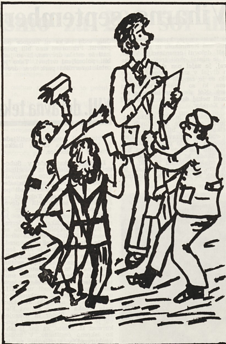
Kdo pa je ta zvezdnik, ki deli avtograme? To ni noben zvezdnik, ampak naš obratovodja, ki podpisuje nadure.

Hvala za sodelovanje in drugič kaj več sreče!