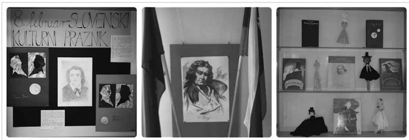
Slika 1: Razstave izdelkov, ki nastanejo pri pouku in dopolnjujejo kulturni praznik.

Od 6. do 9. razreda pa Prešerna obravnavajo pri slovenščini, saj je v učnem načrtu in berilu, ter pri drugih predmetih (zgodovini, angleščini, likovni in glasbeni umetnosti ter pri domovinski in državljski kulturi in etiki). Književno delo obravnavajo pri medpredmetnem povezovanju s šolsko knjižnico, kjer učenci uporabljajo tudi različne IKT-pripomočke za branje ter pregledovanje literature o