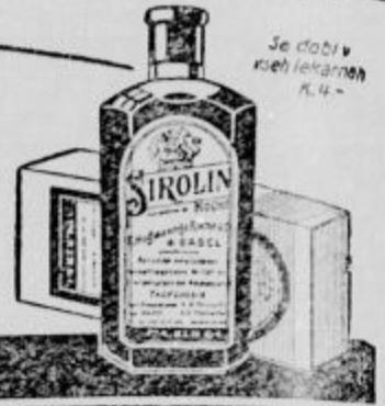
Se dobi v vsih lekarnah K. 4.-