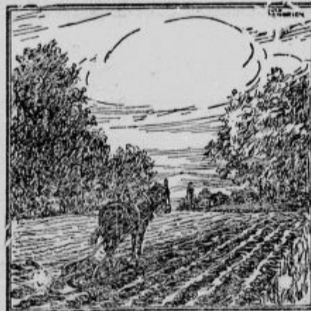
Kje je orač?