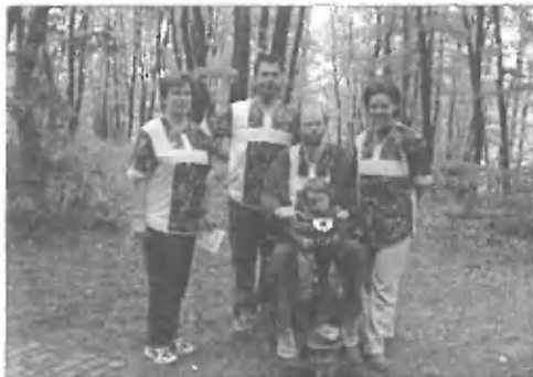
Člani OK Trzin pred pričetkom tekmovanja v precizni orientaciji

P oznate orientacijski tek? To je športna disciplina, kombinacija teka in orientacije po neznanem terenu, ki največkrat poteka v gozdu. Tekmovalci mora le s pomočjo karte in kompasa v čim krajšem času poiskati vse kontrolne točke, ki so vrisane na karti in na terenu označene z oranžno belimi zastavicami. Zmaga tisti, ki najde vse kontrolne točke v pravilnem vrstnem redu in v najkrajšem času. Pot med kontrolnimi točkami ni določena, saj je to naloga tekmovalca. Pri tem športu je poleg fizične pripravljenosti pomembna tudi umska