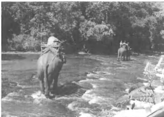
Let s sloni

Takoj, ko sva prispeli v glavno mesto Kambodže Phnom Phen, sva stopili v akcijo, kot smo jo vajeni samo na televizijskih ekranih. Na vsak način sva hoteli čim prej priti do tajске ambasade in s tem do tajске vize. Ker pa je bilo že pozno popoldne in je sonce vedno bolj sililo za obzorje, se nama je neznansko mudilo, da nama ne bi pred nosom zaprli vrata. Taksisti na motorjih so takoj, ko sva se pojavili na ulici, zavohali biznis in se kot muhe zbrali okrog naju v neznanski gruči ter drug čez drugega brenčali, vpili ter se prerekali, kdo bo našin voznik. Že tako sva bili živčni, potem pa še ti kričeči jastrebi, s katerimi se ne da normalno zmeniti! Toda kar naenkrat me je prevzel adrenalinski val, moment za tem sem se popolnoma vživela v trenutno situacijo ter se prelevila v nekaj popolnoma drugega kot običajno. Nastopila sem kot veliki šef, pri čemer se mi je vrat razpotegnil nekam proti oblakom kot žirafi, ki se steguje proti listju na najvišjih vejah drevesa. Najprej sem s suvereno držo velikega mogotca vse utiňala in takoj za tem začel