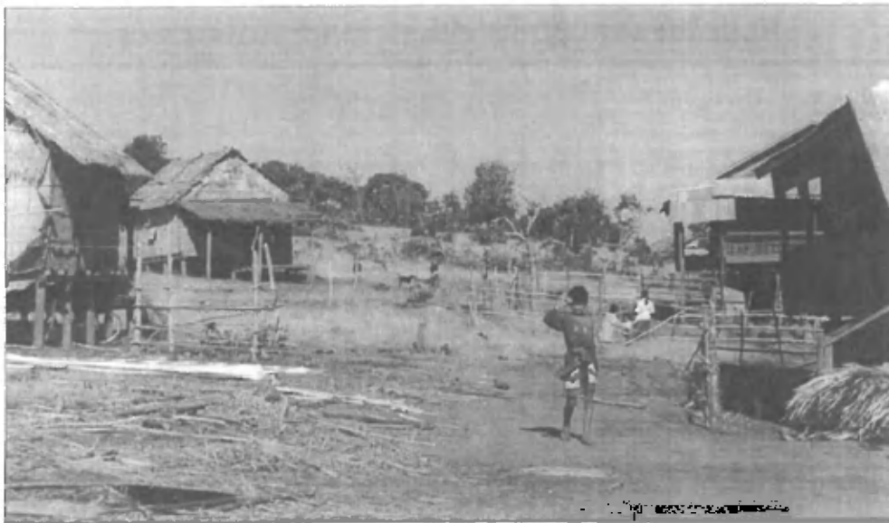
Vasica Pontag (provinca Monduliri) v objemu divje, rdečkaste pokrajine

Pa sem jih spet utišala. Vsi so držali prste na ustih, ko sem na koncu pribila, da plačava samo en dolar na osebo, kar je za vožnjo tujcev izredno nizka tarifa, in to v obe smeri - tja in nazaj. Za čudo so bili zopet vsi za (verjetno zaradi velike konkurence, no, pa tudi zaradi moje odločnosti), in so ponovno pričeli kričati: ja ja, jaz, ja, jaz ... No, pa sva izbrali najbolj simpatičnega in smo se odpeljali po kaotičnih cestah mesta, pri čemer sem nenehno priganjala motorista, naj vendarle malo bolj prične na plin.