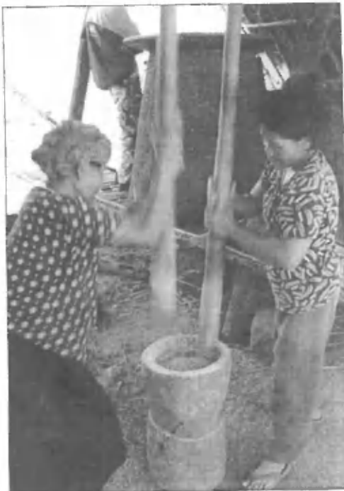
Domaćinki na vasi pri domačem opravilu, ločevanju riža od njegovih luščin