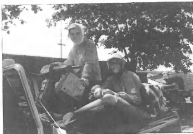
V zadnjem delu pick - upa sva se v eno smer peljali približno 7 ur (skupaj z domačini in njihovo kramo).

ali pa s krščanstvom. Toda še vedno je okoli njihovih hišk videti drevesca, narejena iz slame, ki jih domačim postavljajo z namenom, da bi jim prinesla srečo. Pod temi drevesci nato duhovom žrtvujejo žival in z njeno krvjo namažejo drevesce. Verjamejo, da bo to prineslo dobro letino, zdravje... Imajo tudi hišice, v katerih prebivajo duhovi. Skralka zanimivo, predvsem za tiste, ki neradi na vsakem koraku srečujejo turistin in si želijo doživetje neokrnjene narave ter drugih kultur. Ko sva se po nekaj dnevih zopet vrnili v Phnom Phen in dobili svoji dve težko pričakovani tajski vizi, sva si kupili avtobusni karti direktno do Bangkoka - da ja spet ne bi imeli kakšnih problemov na meji. V Bangkoku sva se tako kot večina popotnikov zasedrli na najbolj turistični ulici Khao San Road. Na tej ulici je namreč vsega na pretek: polno restavracij, trgovin, prenočišč. Sicer pa nama to veliko mesto ni kaj prida zlezlo v srce. Veliko mesto pač. Zanimivo in pestro predvsem za nakupovanje, preden skočiš na letalo in odpotuješ domov. Kakšna škoda, pa ravno lepo sva se vživel. (Konec)