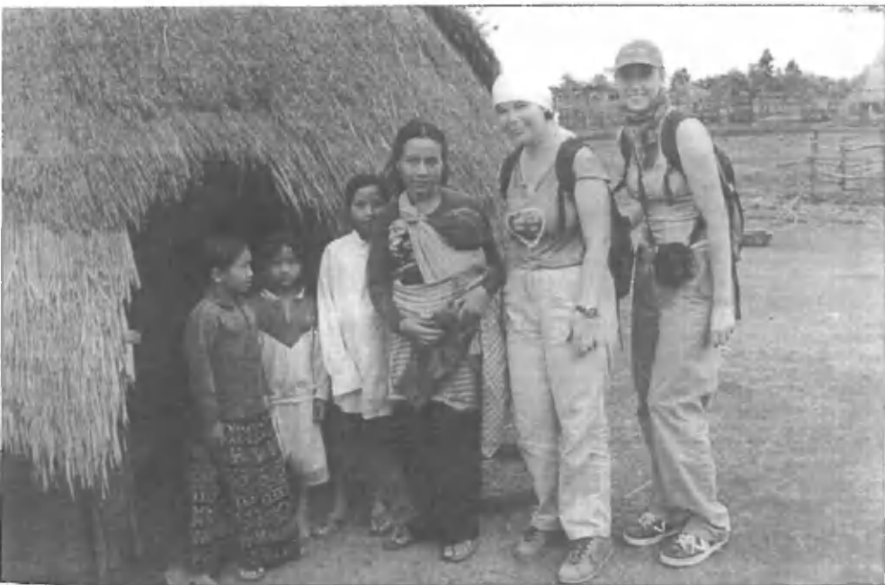
Vasica v provinci Mondulkiri: Mama - otroki pred vaško kočjo krito s slamo