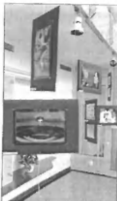
Fotografija z razstave v Centru Ivana Hribarja

Ob tem bi se zahvalila vsem natečajnikom, tistim, ki so pomagali pri postavitvi razstave, in tistim, ki ste si jo ogledali.