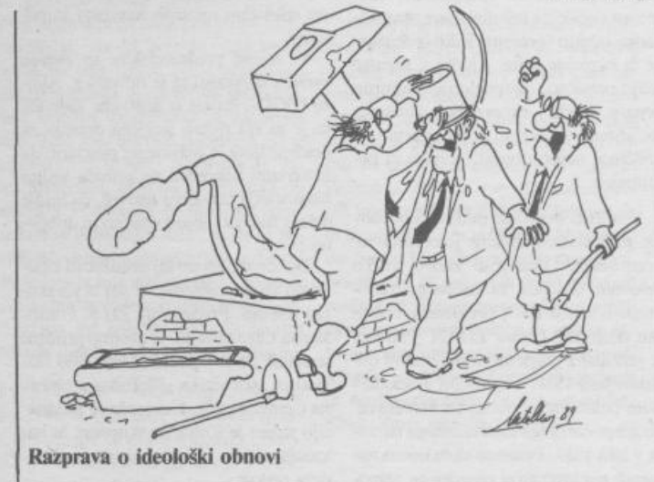
Razprava o ideološki obnovi