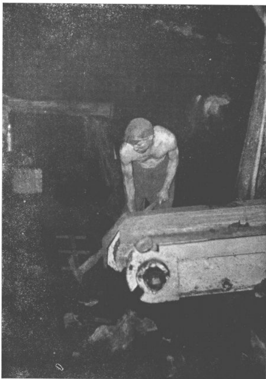
Delo ob transportnem traku

čelih, pa do gumijastih trakov na izvoznih progah.