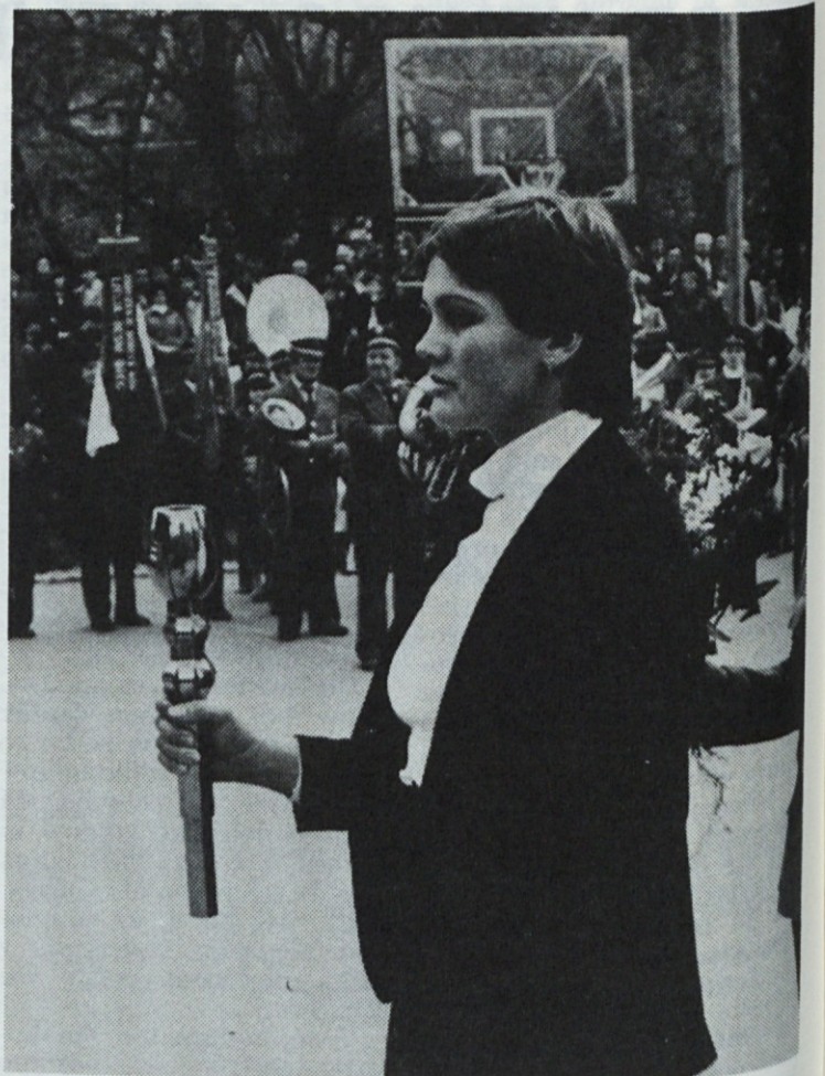
ŠTAFETA OBSTALA V SLUNJU

V nedeljo, 27. aprila smo v Litiji sprejeli Titovo Štafeto — štafeto mladosti. Sprejema se je udeležilo veliko število litijskih občanov.