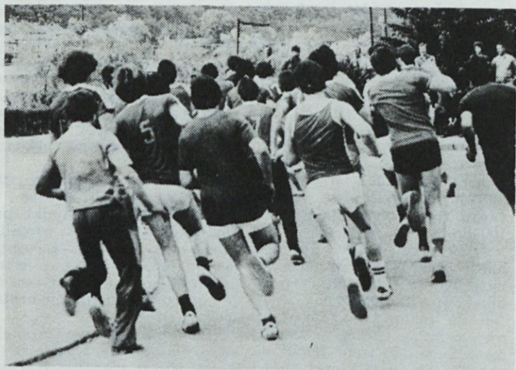
Start na 1500 m