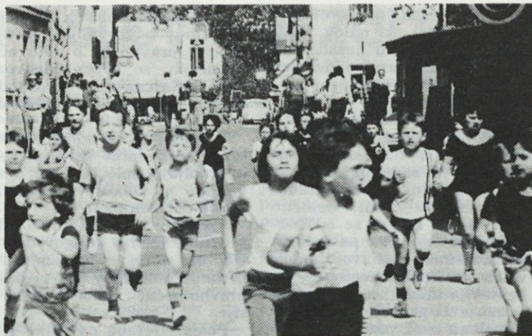
Tekmovali so tudi najmlajši