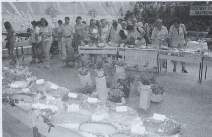
Razstavo v večnamenski dvorani si je z zanimanjem ogledalo veliko število obiskovalcev