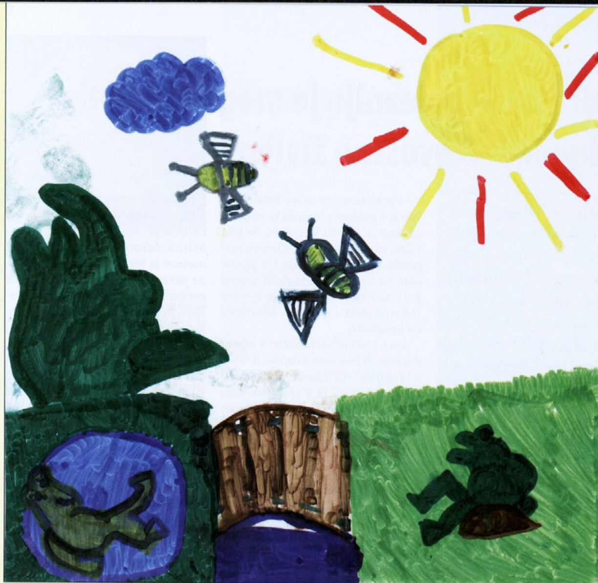
Anže, 9 let