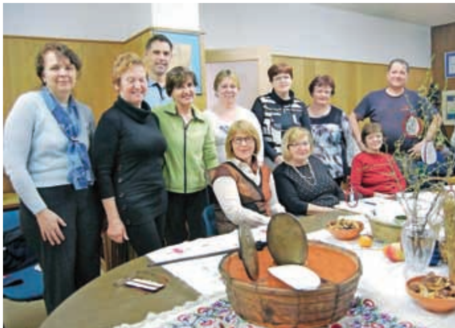
Na študijskem krožku Praznovanja v Smledniku so se tokrat posvetili veliki noči.

Kot drugi se je predstavil študijski krožek Zvedave punce. Deluje od aprila lani. Njihovo ime sporoča, da so radovedne in pripravljene za učenje. "Na