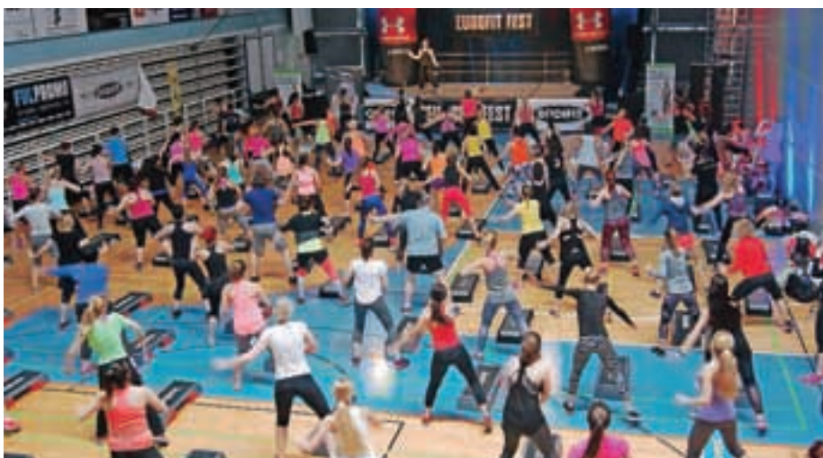
Na prvem mednarodnem festivalu gibanja in rekreacije je bilo več kot sedemsto udeležencev.