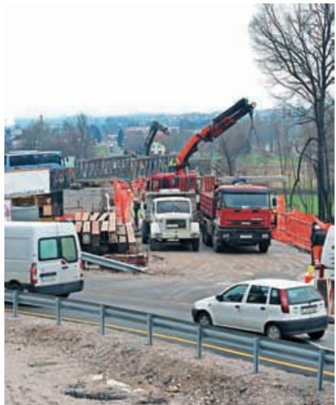
Izmenično enosmerni promet je prek prvega montažnega premostitvenega objekta stekel 25. februarja.