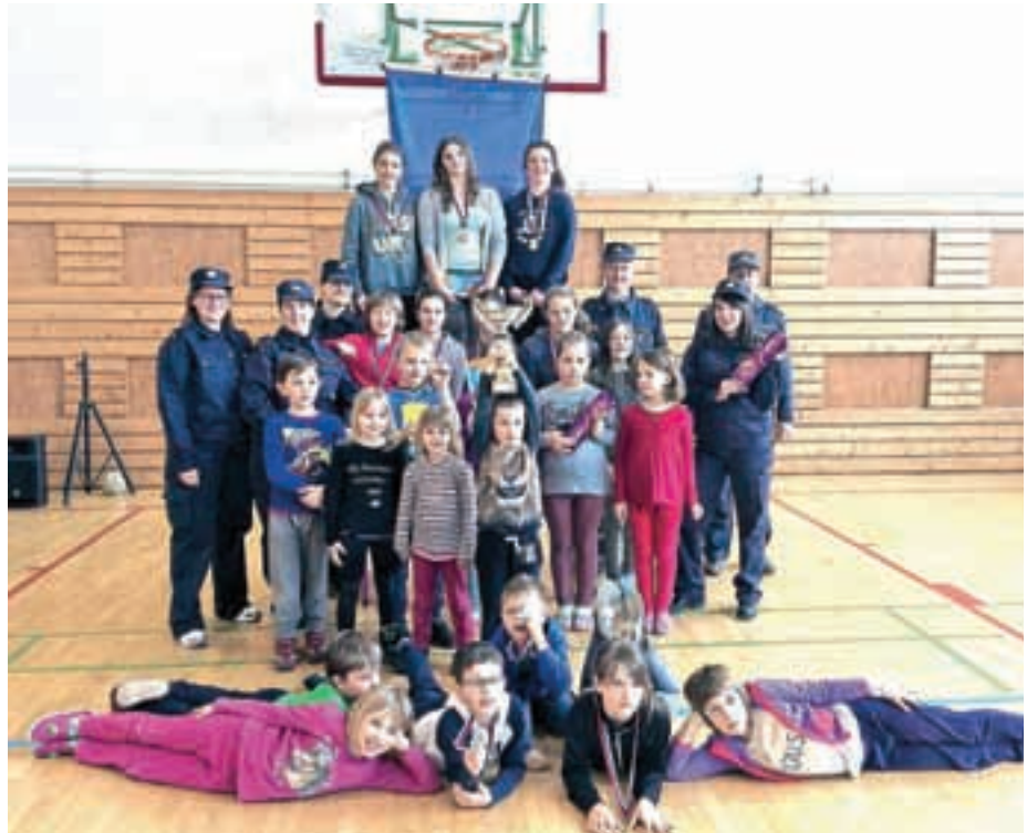
Prehodni pokal so osvojili mladi gasilci iz PGD Sora.