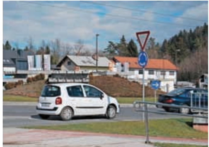
Krožišče bodo rekonstruirali z namenom izboljšanja prometne varnosti.

Nadaljujejo pa se tudi dela na mostu v Mednem. Promet so na prvi montažni premostitveni objekt preusmerili 25. februarja, še vedno pa poteka izmenično enosmerno. Kdaj se bo sprostil v obe smeri in kako potekajo dela, pojasnjujejo na Direkciji RS za infrastrukturo: "Prvi montažni premostitveni objekt je bil postavljen 8. februarja. V času gradnje so bile neugodne vremenske razmere, ki so preprečevale izvedbo nasipov in asfaltiranje cestnega dela obvoza. Zato se je vzpostavitev enosmernega izmeničnega prometa preko prvega montažnega premostitvenega objekta prestavila na 25. februar. S to preusmeritvijo prometa iz regionalne na začasno obvozno cesto pa je omogočen začetek izvajanja drugega opornika za drugi montažni objekt in izvedbačasne ceste na področju regionalne ceste. V primeru zadovoljivih vremenskih razmer bo dvosmerni promet preko dveh montažnih objektov možno vzpostaviti do 25. marca." Pisali smo že, da je bila pogodba z izbranim izvajalcem za izvedbo projekta Rekonstrukcija cestnega objekta čez železniško progo pri Mednem Rafael in SŽ-ŽGP podpisana 30. novembra lani. Izvajalec je bil v delo uveden takoj po podpisu pogodbe. Pogodbeni rok za dokončanje del je 180 dni po uvedbi v posel.