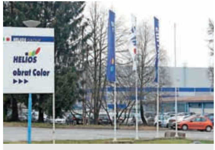
Heliosov obrat v Preski

Ta odločitev je v javnosti zbudila tudi nekaj vprašanj, povezanih z uspešnostjo podjetja. Znano je, da se Helios sooča z velikim upadom prodaje na vzhodnih trgih, predvsem v Rusiji in Ukrajini, kjer so v le dveh letih izgubili načrtovanih 55 milijonov evrov. A v vodstvu družbe mirijo, da razlogov za preplah ni. "Ta padec prodaje uspešno blažimo z novimi produkti. Če bi se prodaja še zmanjšala, bi razmislili o ukinitvi manjših obratov v tujini, nikakor pa ne predvidevamo zmanjševanja števila zaposlenih v Sloveniji, torej tudi v Preski ne. Vse te ljudi močno potrebujemo, saj slovenski sedež podjetja postaja vse pomembnejši," so nam sporočili iz družbe.