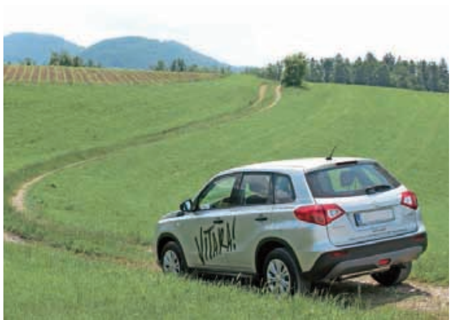
Vladar slabih cest