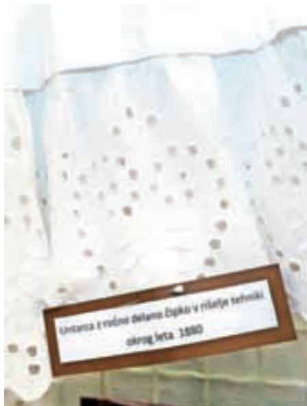
Ročni izdelki prednic članic DU Medvode. Vsi razstavljeni izdelki so starejši od 65 let.