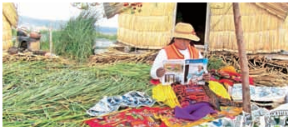
Sotočje očitno seže tudi daleč čez občinske meje. Dokaz za to je fotografija, na kateri ga prebira prebivalka vasi v Peruju. M. B.