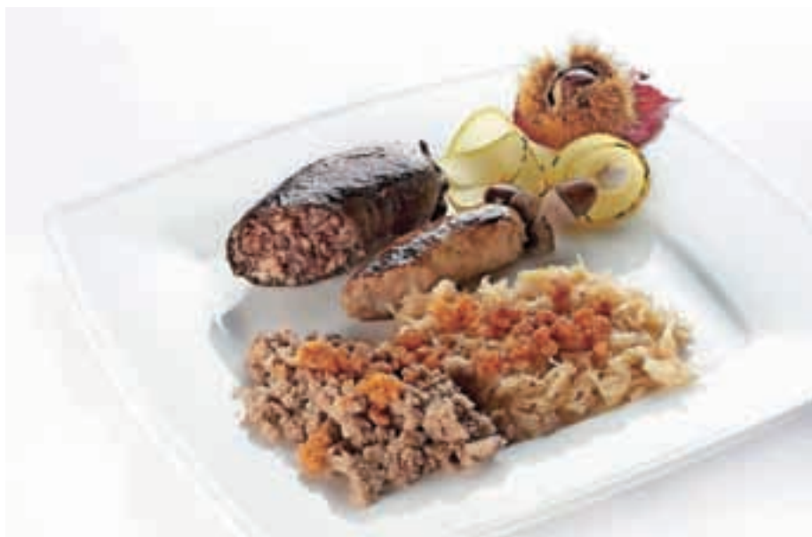
Šest hodov v treh gostilnah. Ponudba je odvisna od sezone.

»Pred kratkim smo Kulinarično popotovanje po medvoških Gostilnah Slovenije predstavili na prvem kulinaričnem festivalu v Celju. Z odzivom smo lahko zelo zadovoljni. Obiskovalcem se je projekt zdel zanimiv, pravzaprav nekaj novega. Ni novo, da ponujamo meni s šestimi hodi, novo je to, da ga pojedete v treh različnih gostilnah.«