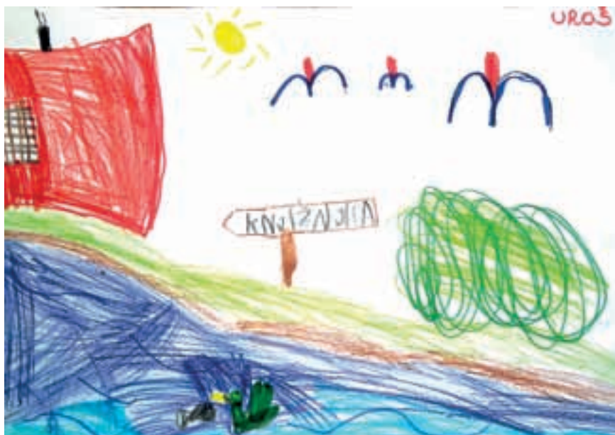
Uroš Milunič, star 9 let in 7 mesecev