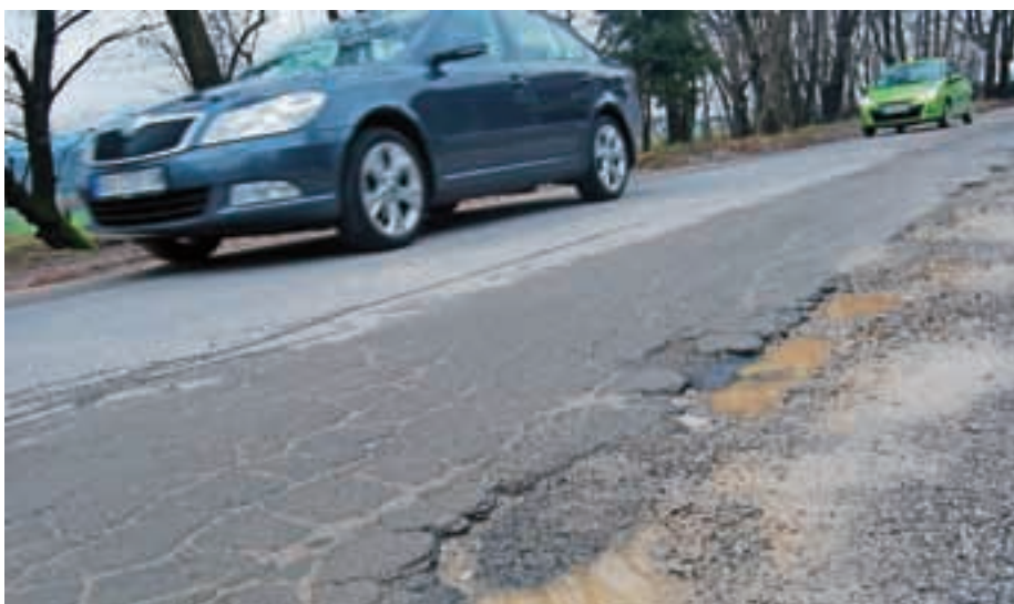
Lokalna cesta Seničica–Medno je zelo prometna in v slabem stanju.