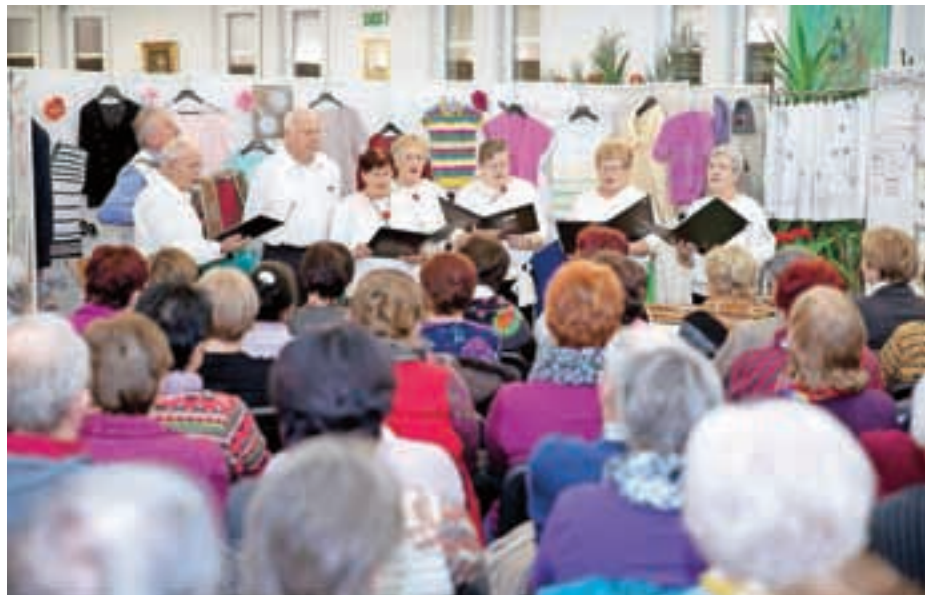
Skupina Sončna jesen s petjem in glasbo popestri dogodke, ki jih pripravljajo v društvu.