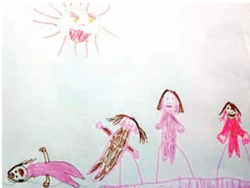
Nika, 5 let