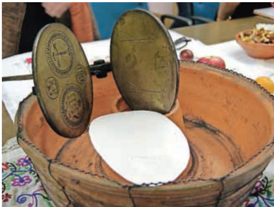
Posebnost v Smledniku so oblati.

Glede na navdušenje verjamemo, da se bodo študijski krožki nadaljevali tudi jeseni.