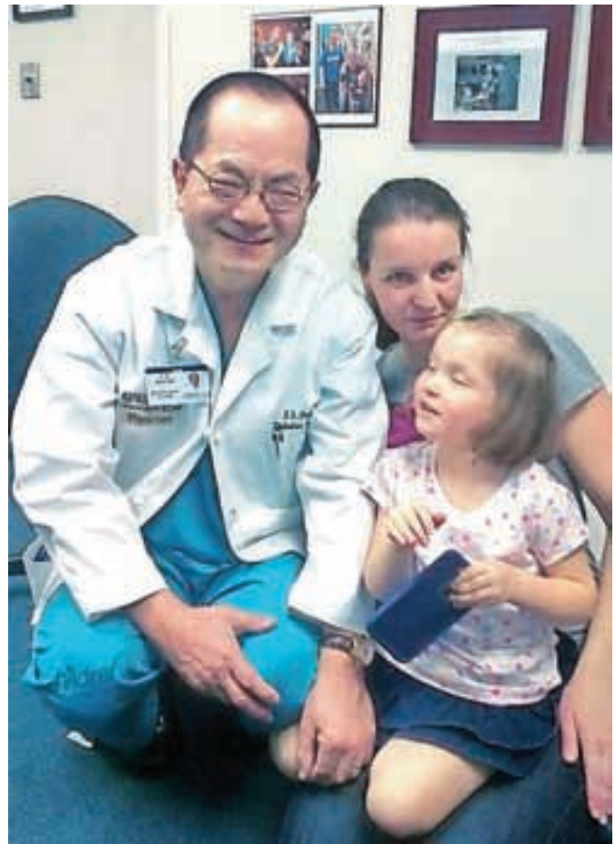
Brino, ki se je deset tednov pred rokom rodila s cerebralno paralizo, so pred kratkim operirali v Združenih državah Amerike.