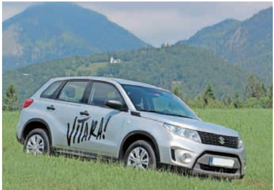
Osnovni model res obstaja!

Vsepovsod nas obveščajo o novih avtomobilih, marketinški prijem se vedno začne z najnižjimi cenami in ne konča z najvišjimi za posamezen predstavitveni model. Namenoma smo iskali avtomobil z osnovno ponudbo in osnovno ceno. Največkrat se zgodi, da stopimo v prodajalno in takega avta sploh ni. Rečemo si, da sploh ne obstaja, in trgovci jih sploh ne naročajo. Tokrat smo se ušтели. Našli smo točno to, kar smo iskali. V ceniku piše, da vitara stane 14.500 evrov, in hoteli smo jo videti. Dobili smo jo celo za