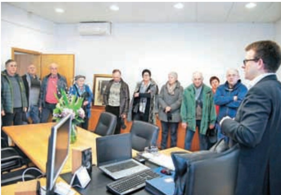
Župan je občane popeljal po celotni občinski upravi. Ustavili so se tudi v njegovi pisarni.