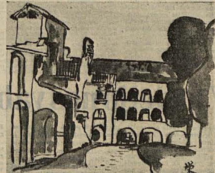
Eisaku Tanaka (Japonska): KOSTANJEVIŠKI GRAD 1961