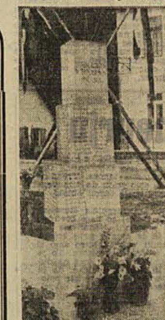
nedeljo odkriti spomenik v Dvoru pri Žužemberku

Potrebno je izreči priznanje tudi organizacijam SZDL in Zveze borcev v Suhi krajini, ker so se odločno zavzele za ureditev spomeniških zadev na področju Suhe krajine. Med te naloge spada zlasti urejanje partizanskih grobišč in postavitve spomenikov