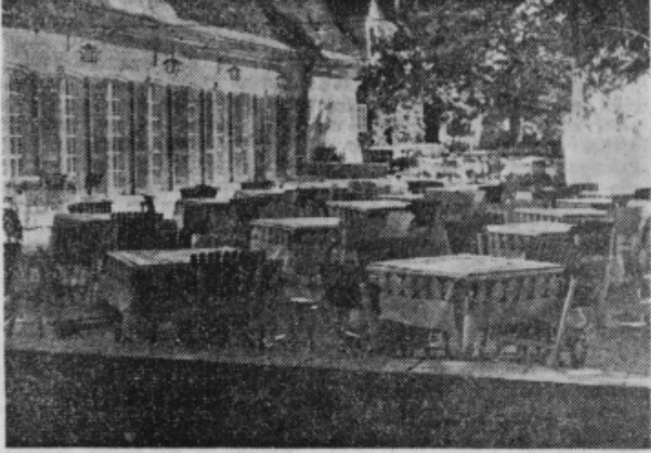
V soboto, 6. septembra t. l. dopoldne je bila na ptujskem gradu slavnostna otvoritev »Restavracije grada« v Ptuj, ki jo je uredilo podjetje »Slovenske gorice« in jo bo tudi samo vzdrževalo.