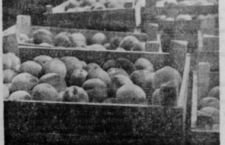
Prvovrstne breskve ZG. Osojnik ŠTUKI — OREŠJE za domači trg in izvoz v Avstrijo

gorice« in »Vinarska zadruga« sta dobili poleg visokih odlikovanj za vzorce vin 9 zlatih medalj tudi dve priznanji za vinsko embalažo. Razstavljena vina je na IV. Mednarodnem vinskem sejmu v Ljubljani poskušalo okrog 80.000 ljudi.