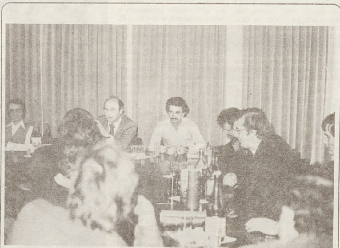
Dne 13. IV. nas je obiskala skupina slušateljev občinske politične šole ZKS, ki je obisk v Novolesu združila z zaključnimi izpiti. Namen obiska je bil, da slušatelje seznanimo z razvojem dohodkovnih odnosov v naši delovni organizaciji, saj je to ena od osnovnih tem v programu dela osnovnih organizacij ZK in ostalih DPO ter samoupravnih organov.