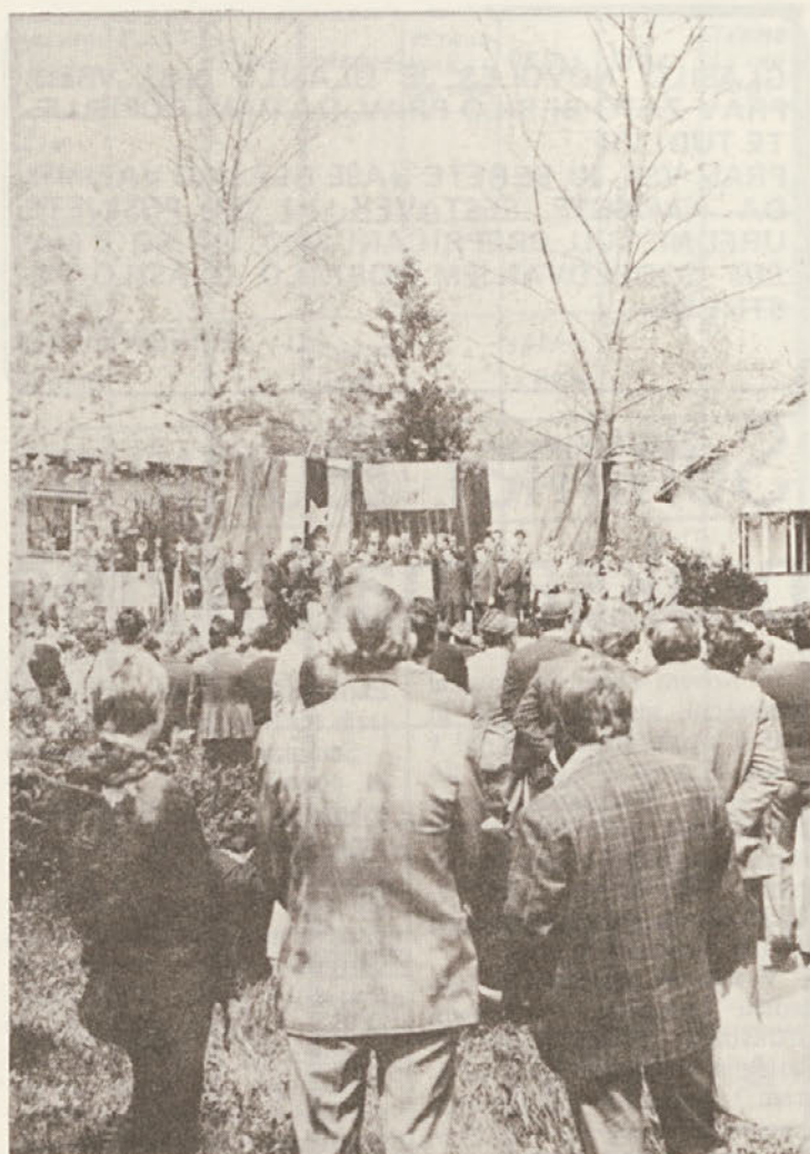
***** * V NOVOLESU SMO NA VELIKI PROSLAVI, KI * * JE BILA 26. 4. V STRAŽI, PROSLAVILI 60-LET- * * NICO ZKJ, SKOJ IN REVOLUCIONARNIH SIN- * * DIKATOV. * *****