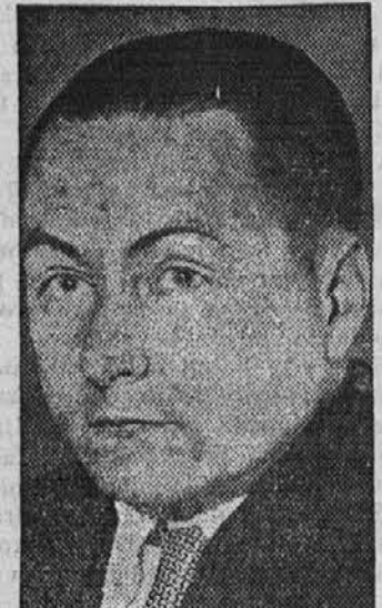
Odvetnik Fisher objublja, da bo dokazal, da je Hauptmann po krivem osumljen strašnega zločina.

Pa moda? Da, tudi lepo, smotrno oblačilo spada k lepoti in novim življenjskim pogojem in razmeram se mora spriti prilagodevati tudi naša obleka. Še več: tudi izpremenba zaradi izpremembe, zaradi okusa samega je še vedno upravičena, najsi so ljudstva po dolge vekove srečno živela in še žive v svojih narodnih nošah. Zato je "moda" upravičena in vsaka pametna žena bo rada vpoštevala vse modne novosti, ki pomenjajo resničen napredek, resnično izboljšanje prejšnjega. Nikoli pa si ne bodo dale vsiliti od mode kar na slepo vseh njenih muhavih domislekov, sploh ničesar, kar se kakorkoli ne strinja z njihovo osebnostjo. Vedno se bo morala vsaka moda prilagoditi njihovemu okusu, ne one njenemu, nikoli se ne bodo ponižale, da bi bile olovaska vprega vozu modnih spekulantov.