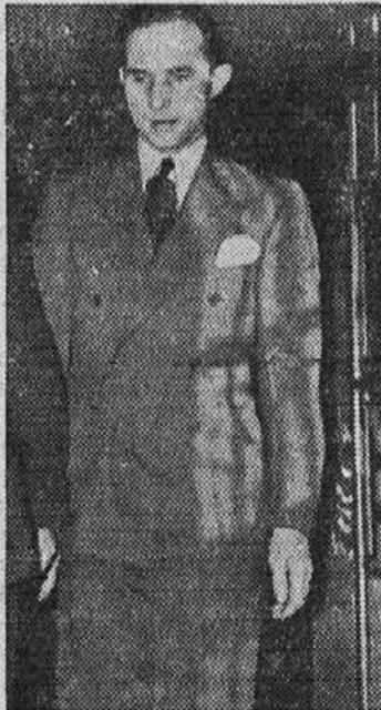
Obtoženec Hauptmann, ki se je pretekli dni zagovarjal. Pravi da je nedolžen.

Proces proti B. R. Hauptmannu, eden izmed najbolj senzacionalnih v kriminalni zgodovini, se bliža svojemu zaključku. Hauptmann, nemški izseljenec, je osumljen, da je ugrabil sinčka svetovnoznane letalca Lindbergha, ga umoril, ter ga ni mogel skriti, nato pa sprejel odkupnino.