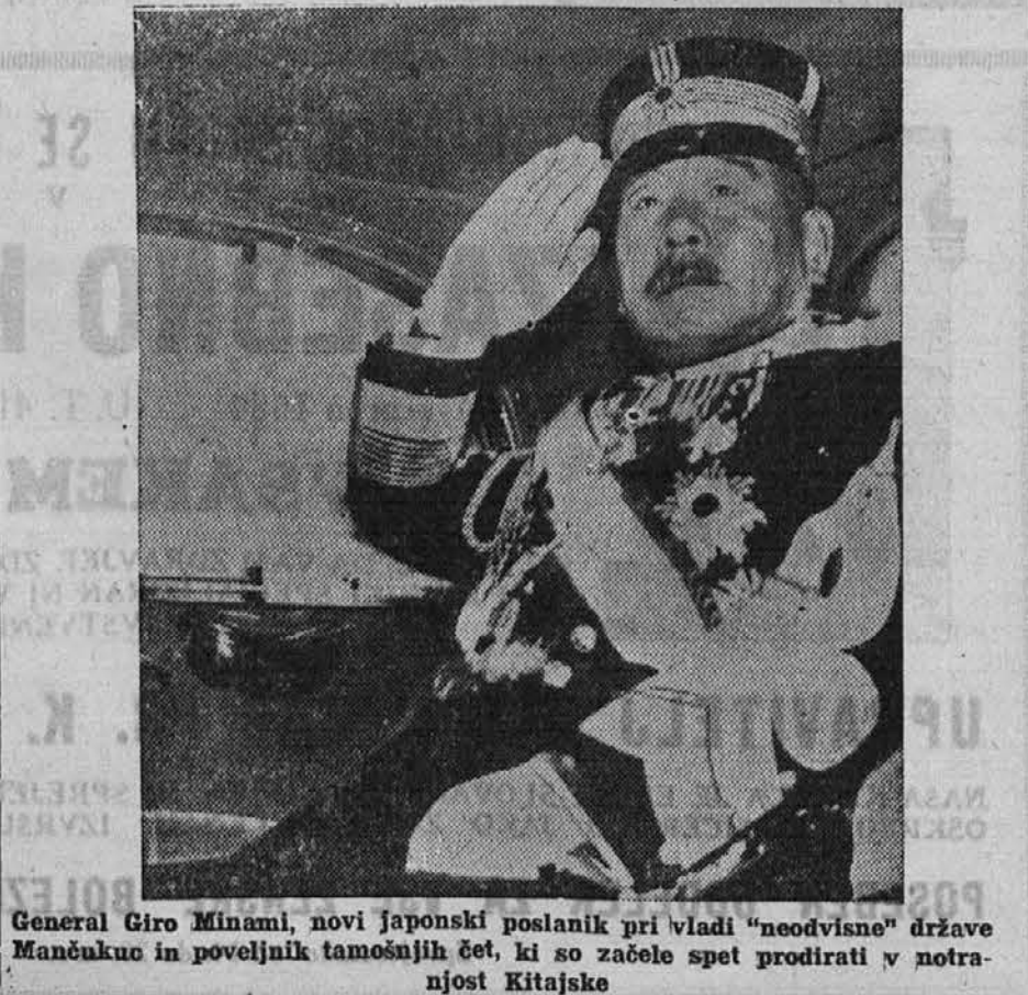
General Goro Minami, novi japonski poslanik pri vladi "neodvisne" države Mančukuo in poveljnik tamošnjih čet, ki so začele spet prodirati v notranjost Kitajske

Iz Rima poročajo, da se je v sredo zaključila pred posebnim fašističnim tribunalom razprava proti skupini obtožencev iz Kopra in okolice. Policija jih je obdolžila, da so rovarili proti Obtožencem. Imen poročila ne navajajo. Obtožencev je bilo devet in tribunal jih je obsodil na ječo od treh do dvanajset let.