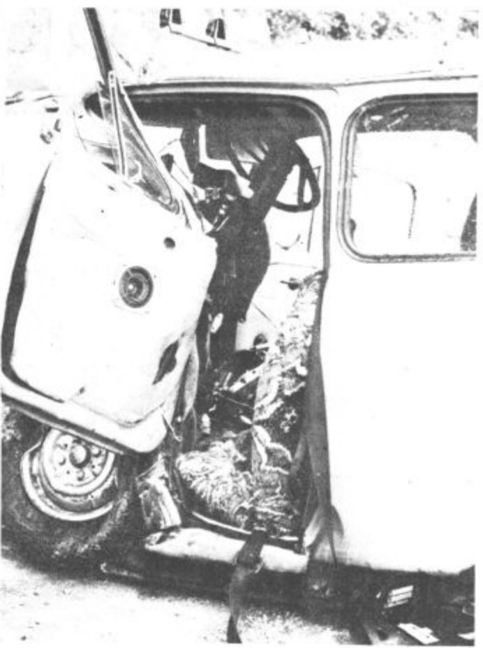
Črni dnevi za našo prometno varnost. Zakaj? Zakaj si ceste lastimo?! Zakaj pozabljamo, da z objestno, brezobzirno, nevarno vožnjo ogrožamo tudi življenja drugih ljudi?! Zakaj?! V nesreči v soboto na Partizanski cesti v bližini križišča s svetlobnimi znaki pri tovarni Gorenje je zgubil življenje otrok. Posnetka naj nam bosta v opomin