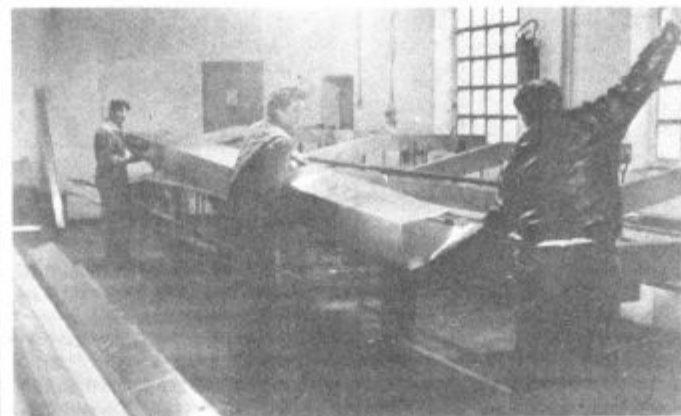
Olažšano delo, prihranek deviz, potrditev lastnih sposobnosti in še marsikaj pomeni nov stroj

juje znanje in sposobnosti domačih delavcev in strokovnjakov. Če bi le takšni zgledi našli plod na tla tudi drugod!