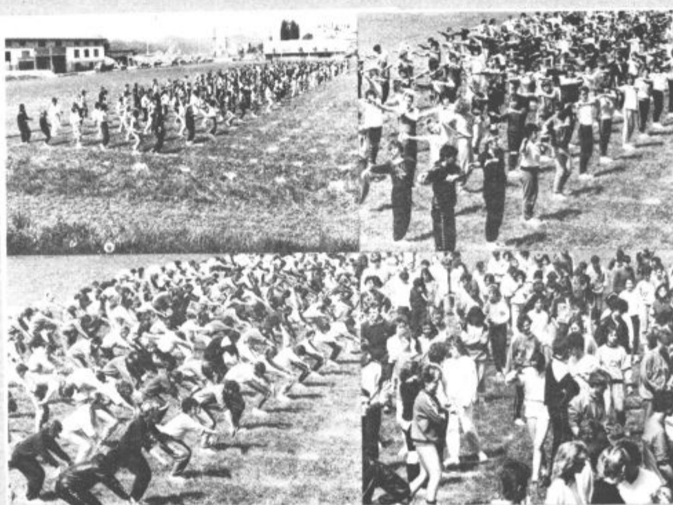
117 mladih iz velenjske občine, predvsem dijakov Centra srednjih šol iz Titovega Velenja, ter 97 mladincev iz drugih slovenskih občin in krajev (Kranja, Kočevja, Radeč, Trbovelj, Krškega, Ljubljane in Nove Gorice) je od torika do petka prejšni teden v Rdeči dvorani v Titovem Velenju, pri osnovni šoli bratov Mravljakov ter na pomožnem Rudarjevem igrišču ob jezeru pridno vadilo »slike«, ki jih bodo mladi iz Slovenije zaplesali na sklepi prireditvi ob letošnjem dnevu mladosti. V soboto so nato z vlakom odpotovali v Beograd, kjer se sedaj skupaj z drugimi pripravljajo za kar najbolj uspešen nastop.

Odbor za prihod vlaka pri predsedstvu OK SZDL je medtem pripravil podroben program bivanja nekdanjih gostiteljev pri nekdanjih slovenskih izgnancih oziroma njihovih naslednikih pa tudi drugih, saj so se bratske vezi v letih, ko vlak vozi v eno oziroma drugo stran, zelo razširile. Tudi delegacija velenjske občine bo pozdravila svoje pobratime že v Krškem, kjer se bo vlak najprej ustavil. Od tu bo vlak nadaljeval pot proti Celju, Mariboru in Jesenicam. V Titovem Velenju bomo dragim gostom pripravili sprejem s krajšim kulturnim programom v prostorih Glasbene šole. V soboto bodo gostje preživel pri svojih gostiteljih, v nedeljo, 7. junija pa se bodo vsi skupaj zbrali na letališču v Lajšah na tovariškem srečanju. Našim pobratimom bomo ob dnevi od 5. do 8. junija seveda pokazali tudi naravne in zgodovinske zanimivosti naše doline. V ponedeljek, 8. junija, pa se bomo spet poslovili od njih z novo željo po čim hitrejšem snidenju. (vos)