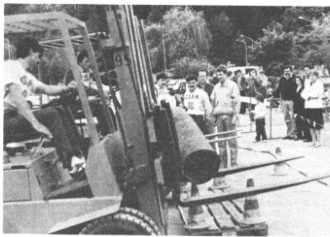
Viličaristi so pokazali veliko znanja in spretnosti

Bodimo torej bolj previdni! Ne sedajmo za volan vjnjeni! Naj bo naše vozilo tehnično brezhibno! V Titovem Velenju imamo nekaj črnih prometnih točk. Dobro jih poznamo in dokler nam jih ne bo uspelo odpraviti, vozimo tam še bolj previdno!