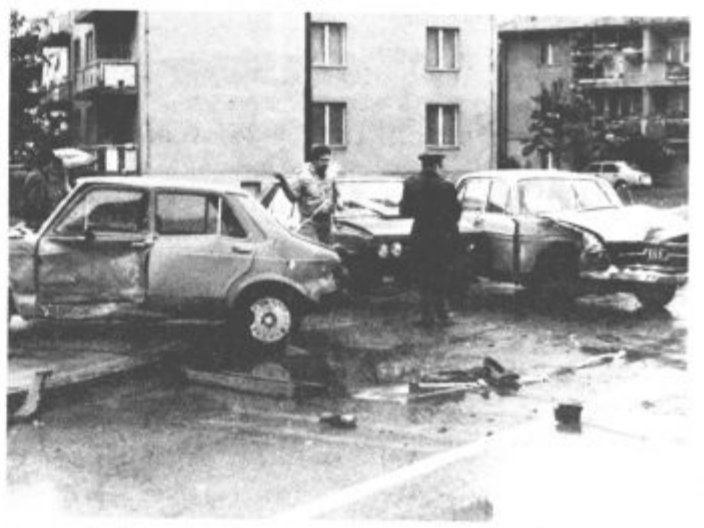
Prav v dneh pred »tednom prometne varnosti« v občini Velenje je bilo takšnih še bolj grozljivih prizorov v našem mestu veliko in preveč. Na sliki je prometna nezgoda, ki se je pripetila v križišču Tomšičeve in Jenkove ceste — ene naših najbolj črnih prometnih točk. (b. m.)