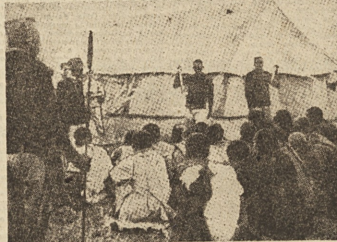
Takole zberejo domačine Kenije, jih odpeljejo v zapore, njihove domove pa porušijo z buldozerji. In potem se čudijo in ogorčeni so, ker domačini ne poljubljajo rok svojim belim gospodarjem

Posebno poglavje zakona je posevčeno kazenskim ukrepom. Če delavec neupravičeno zamudi delo ali izostane z dela (če je izostanek upravičen, določi direktor po svoji uvidenosti) potem ga lahko premestijo na slabše plačano delovno mesto, sindikalna organizacija pa mora to kazeno »politično« objasniti kolektivno. »Lažje« slučaje (verjetno manjše zamude in podobne prekrške) mora direktor javljati državnemu tožalcu, ki jih storiča na odgovornost. V »težjih« slučajih pa delavce obsodijo z raznimi »popravnimi kaznimi« (bezurno delo, zmanjšanje plače, odvzem pravic iz socialnega zavarovanja ali celo nekajletno »popoljševalno delo« v koncentracijskih taboriščih).