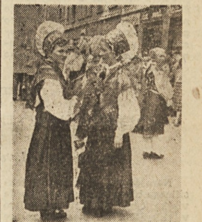
V dneh Ljubljanskega festivala vidimo na ulicah veliko fantov in deklet v narodnih nošah iz vseh krajev Slovenije.

Ljubljančani so v teh dneh praznično razpoloženi. Prireditve