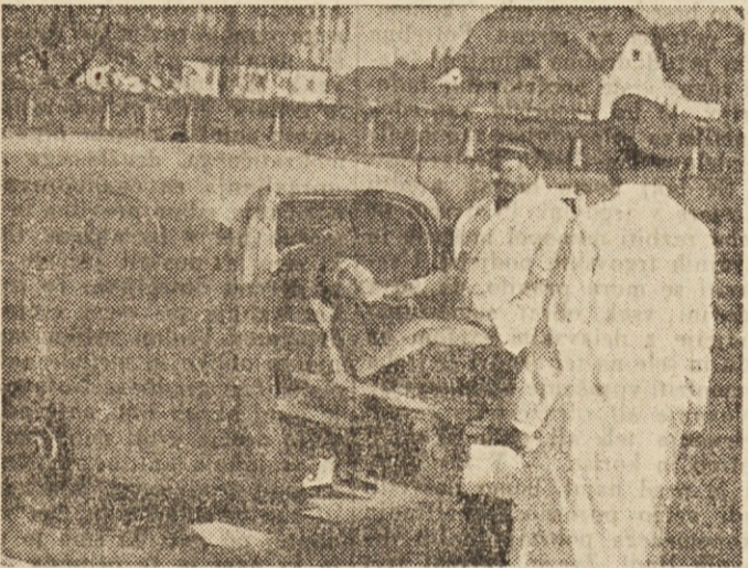
Hitro prevoz v bolnišnico mnogokrat reši ponesrečencu življenje

Ljudje navadno zelo pazimo na napake zdravnikov in jih radi grajamo. To je sicer pravilno, saj so za svoje delo pred skupnostjo odgovorni. Prav pa je tudi, če se včasih spomnimo, da je njihovo delo pri reševanju človeških življenj zelo naporno in da zahteva veliko požrtvovalnosti, samozatajevanja in odgovornosti. — m