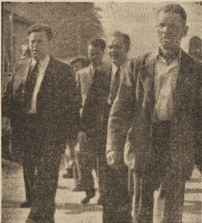
Več godb je spremljalo slovenske rudarje od železniške postaje v zgornjo hrastniško dolino

Hrastniška godba je na Zletu rudarjev prejela dve diplomi za svoje dosedanje delo, in sicer od