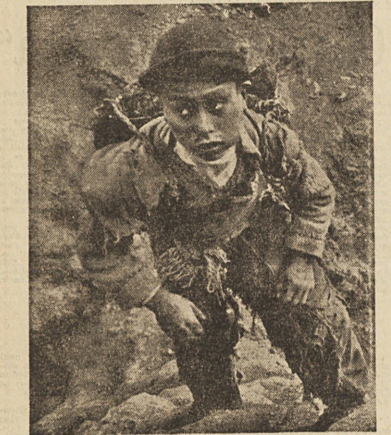
Tudi otroci delajo v bolivijjskih rudnikih kositra, ki jih je pred nedavnim bolivijska revolucionarna vlada nacionalizirala. Ti mladoletni delavci so že od mladih nog občutili izkoriščanje ameriških magnatov. Zato bolivijski proletarski naraščaj podpira boj svojih očetov proti domačim in tujim izkoriščevalcem

Zahodnonemški časopis poročala, da je bilo v skoro vseh sovjetskih enotah, ki so jih poslali v Berlin drugo vzhodnonemško mesto, da so zažrtje nemira, nekaj vojakov, ki niso hoteli ubijati nemških delavcev. Vojske so sovjetska vojaška sodišča obsodila na teške zaporne kazni, mnogi pa celo na smrt.