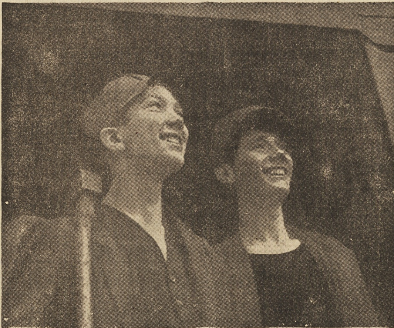
Mladosten zanos diha iz teh dveh mladeničev-rudarjev. — Njunih ramen ni ukrivil težak čas pred desetletji. Glad, stavke, boji za vsakdanji žitek. S svojimi rokami z vsem mladostnim zanosom gradita sebi in potomcem temelje lepšega in boljšega življenja

Tik pred začetkom vojne so v Ilijašu pri Sarajevu dogradili veliko tovarno. Toda Nemci so vse naprave nove tovarne odpekljali, tako da so na tej prostorni poljani ostali le goli temelji. Sedaj pa gradimo v Ilijašu novo livarno. Gradbeni delavci že zidajo deset velikih livarskih dvoran.