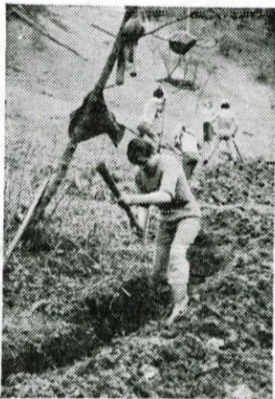
Vaški mladinci pomagajo pri gradnji vodovoda