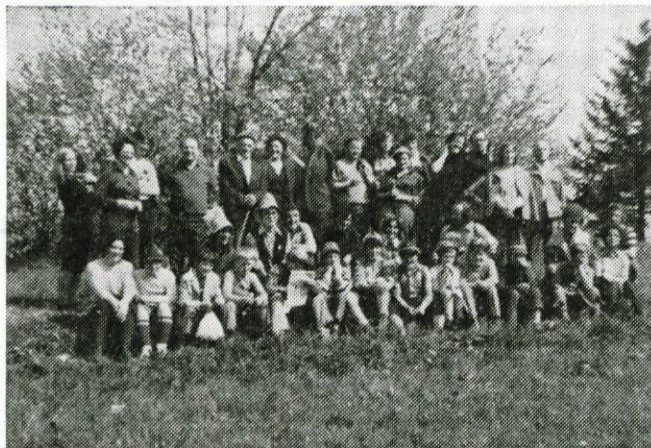
Z izleta na Kopitnik in Gore

Na izletih je bilo poprečno 40 planincev. V poletnih mesecih bosta dva izleta v Kamniške in Julijske Alpe, jeseni