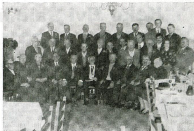
Naši borci za severno mejo skupaj z gosti na slovesnosti

padnost borcev lastnemu narodu in jugoslovanskim narodom, borbena povezanost med borci za severno mejo in borci NOV ter ugotovil, da bi naša severna meja najverjetneje tekla »mnogo nižje«, če ne bi bilo generala Majstra in njegovih borcev, z narodno zavestjo, ki so jo vsi takrat izpričali. Ob tem je navzoče spomnil na sedanjo politično situacijo, ki so jo ustvarile nazadnjaške iredentistične sile v Italiji ter na borbo naših zamejskih Slovencev v Avstriji za narodnostne pravice, ki se spričo znanih dogodkov vleče v nedogled.