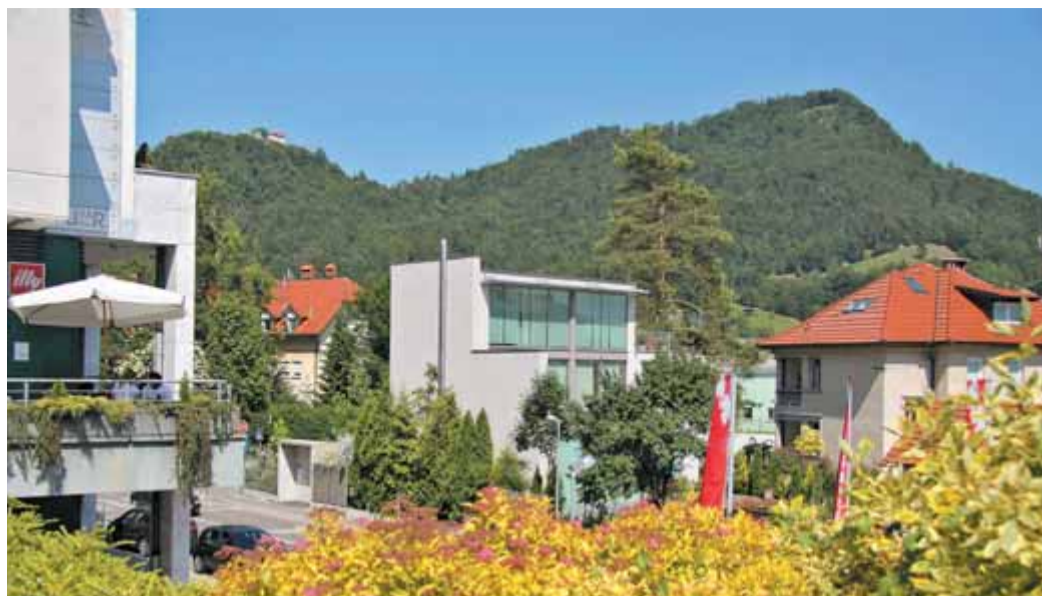
Bela Vila je lep primer premišljene arhitekture v Kamniku. Hiša se odpira proti jugu, zapira pa proti severu ter hrupni cesti. Hkrati s poudarjeno višino definira ulični vogal, ter se, kljub temu da gre za enodružinsko hišo, lepo navezuje na sosednje stavbe - Svetilnik.