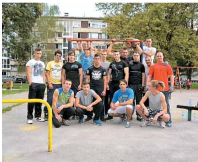
Ekipa StreetWorkout Kamnik