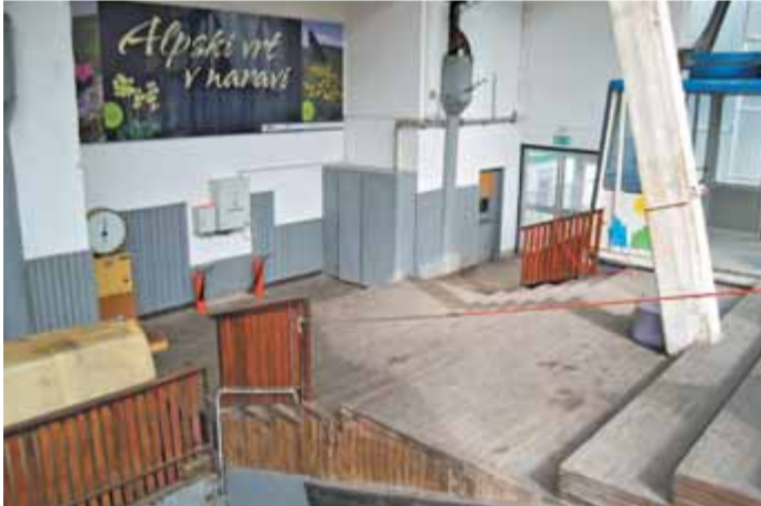
Arhiviran pogled na spodnjo postajo nihalke pred prenavo.