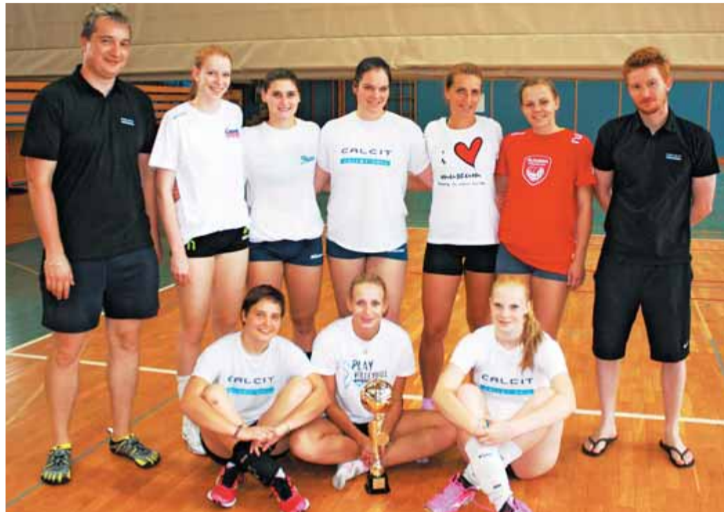
Zmagovalke turnirja Calcit Volleyball.