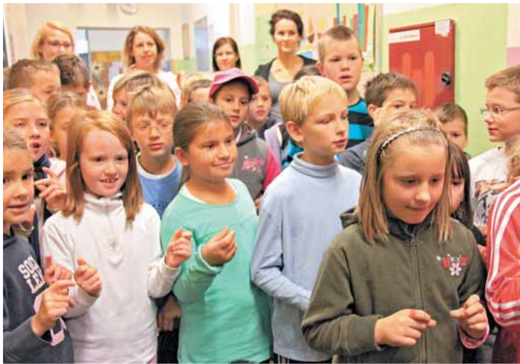
Učence in učenci Podružnične šole Nevlje so se ob prejemu donacije zahvalili s prijetnim kulturnim programom.