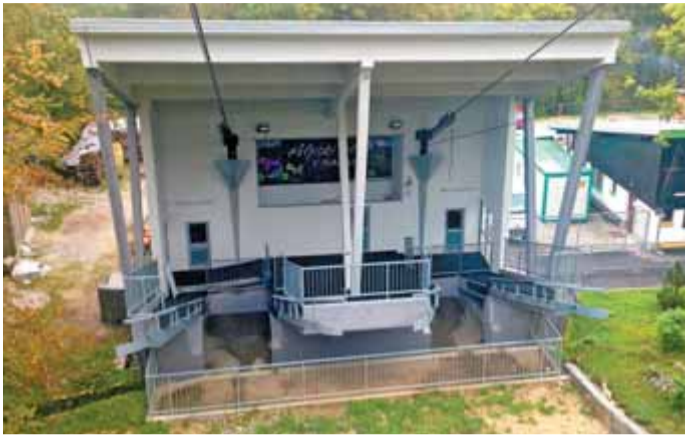
Prenovljena spodnja postaja nihalke na Veliko planino.

Spodnja postaja nihalke številnim obiskovalcem predstavlja prvi stik z Veliko planino. Varnostne zahteve imajo močan vpliv na turistično povpraševanje in z vidika obiskovalca je občutek varnosti v času bivanja in zadrževanja v turistični destinaciji najpomembnejši.