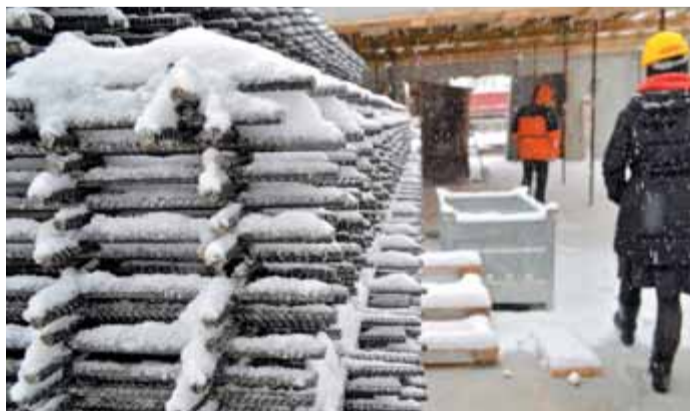
Začetek gradnje Osnovne šole Toma Brejca je zaradi nepredvidenih zapletov zamujal, zato se gradbinci niso spopadli le s težavami dotrajane stavbe, temveč tudi z zimskimi razmerami. Izredno poučno za Skupino Štajn je bilo, ko so na lastne oči videli, kako zahtevna je lahko sanacija starih stavb in izredno mrzlih zimskih dneh, ko je z materiali, kot je beton, skoraj nemogoče delati in kako težko je v resnici oceniti ohranjenost starih stavb.