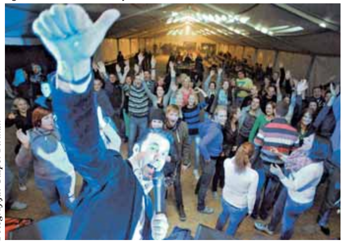
Rok'n'band je razgrel množico pod šotorom v Termah Snovik.