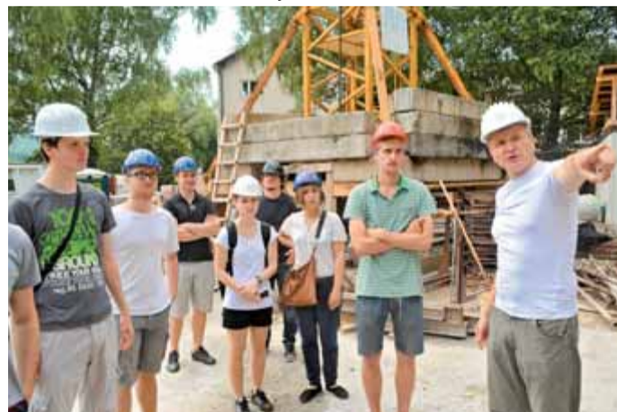
Mladi kamniški (bodoči) arhitekti iz Skupine Štajn že od samega začetka z zanimanjem spremljajo potek gradnje nove kamniške šole. Vsak mesečni ogled se začne z uvodno razlago in opisom trenutnega stanja na gradbišču, katerega jim običajno predstavi izvajalec.