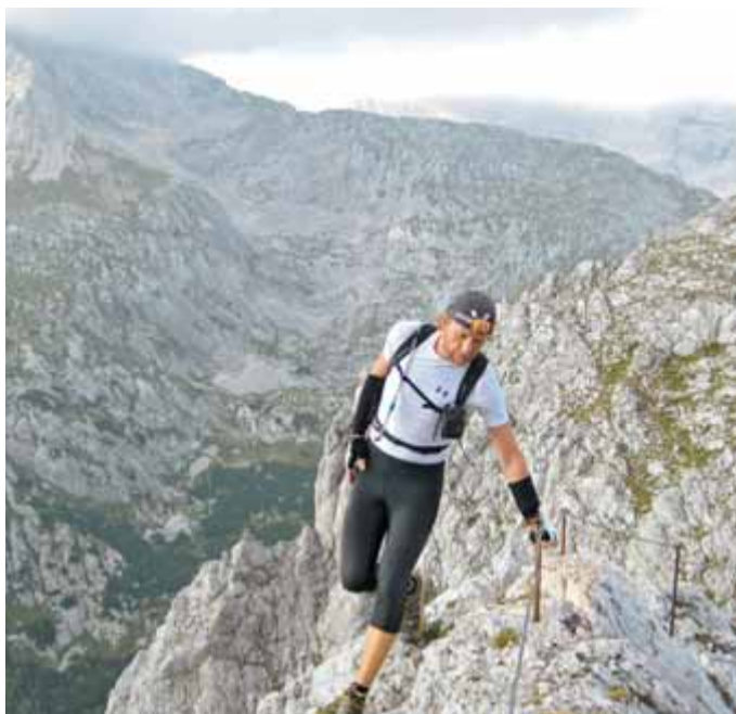
Na poti proti Kalškemu grebenu.