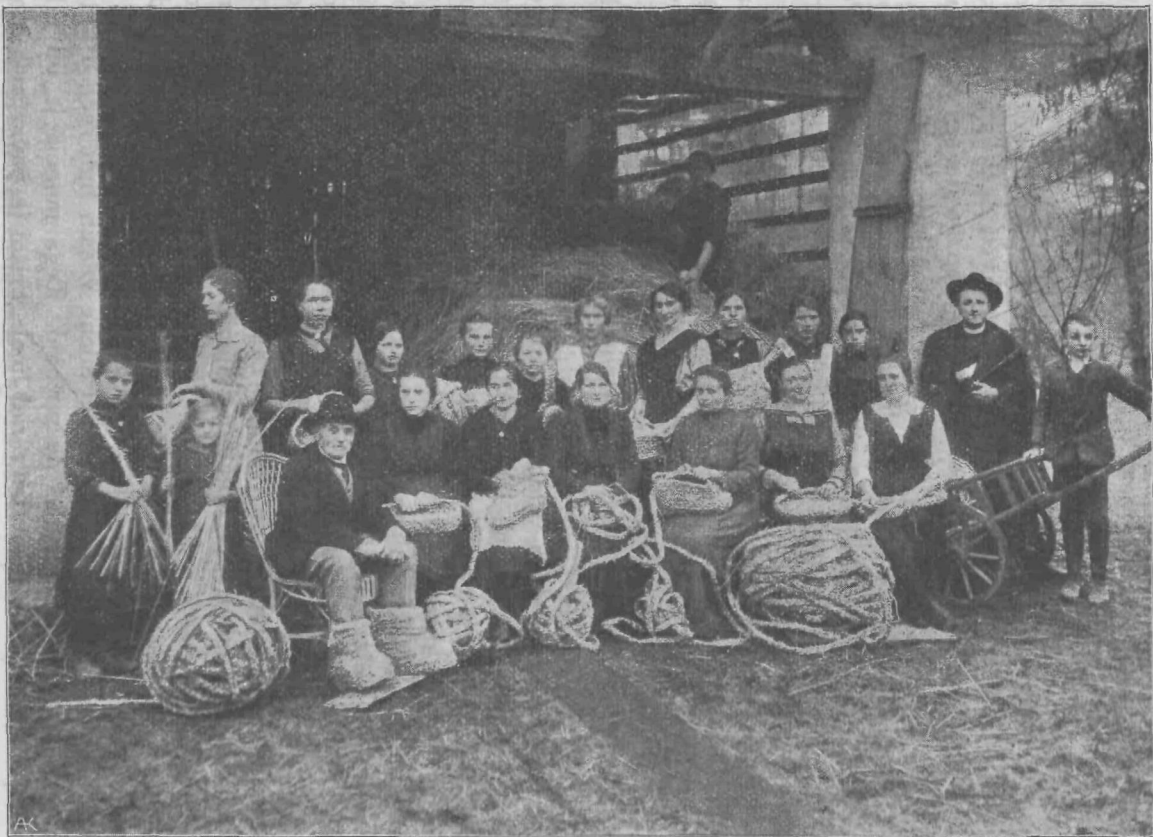
Izdelovanje slamnatih obuval v Spodnji Idriji.