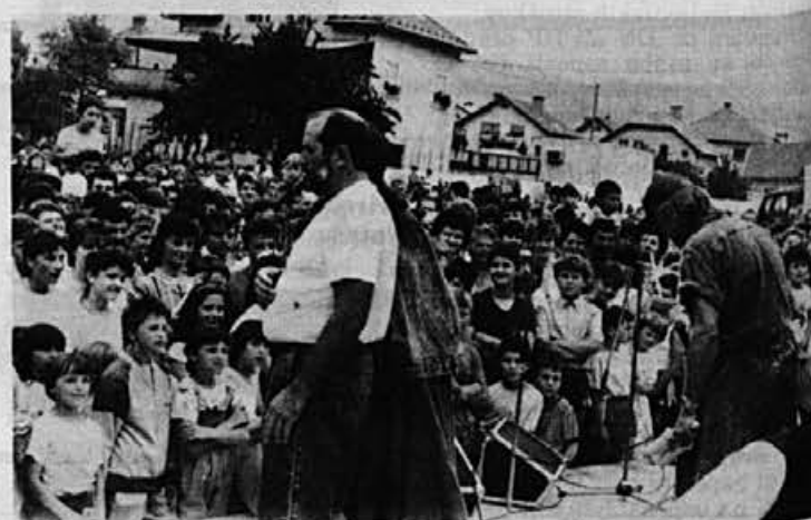
Moped show je pritegnil množico, zlasti mlajših poslušalcev