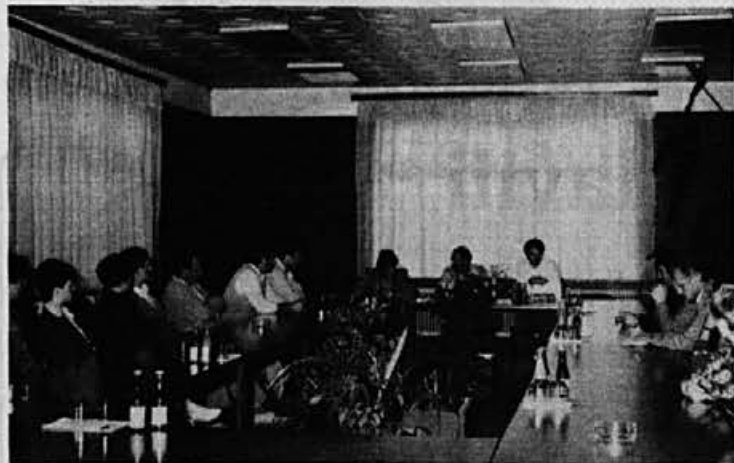
S slavnostne seje delavskega sveta delovne organizacije Delegati so potrdili tudi predlog priznanj, ki so jih delavci in drugi prejeli na proslavi 4. julija.