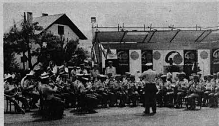
Proslavo je začel naš pihalni orkester

Naših nalog se moramo še bolj zavedati sedaj, ko so težki časi in v situaciji, ko nam država s svojimi ukrepi nerealnega tečaja dinarja, krade težko prislužene devize in ko prihajamo v sramotno situacijo, da se moramo postavljati v vrsto pred bankami, ki zaradi znane situacije v državi tudi ne plačuje naših računov. Kljub temu mislim, da je to trenutno, da se bodo stvari vendarle izboljšale in zato moramo, ne samo dobro opravljati svoje delo, temveč, da vse svoje ustvarjalne moči usmerimo v razvoj in kakovost našega dela.