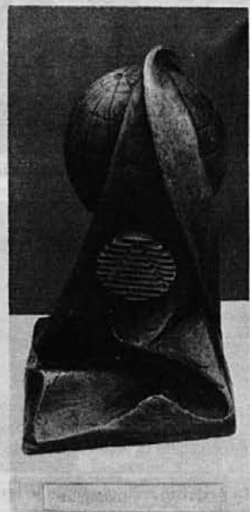
Kipec Alpine kot najvišje priznanje