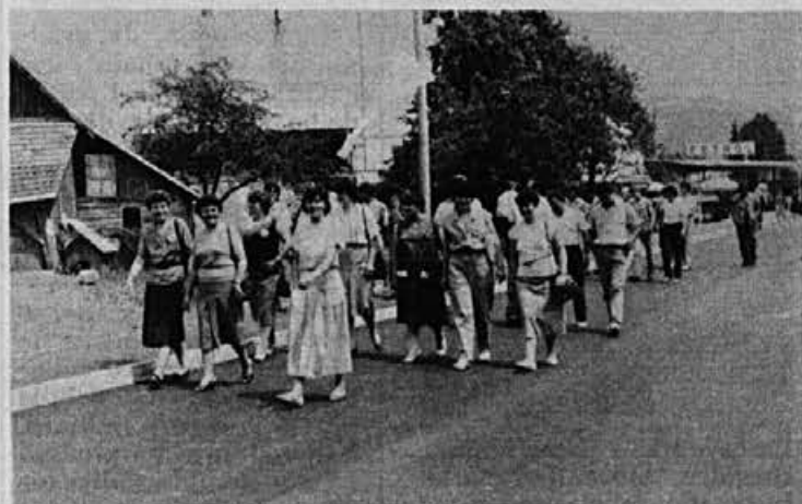
Naši delavci so prihajali iz Žirov in okolice, iz obratov na Colu, v Gorenji vasi, Rovtah in Šentjoštu, iz prodajaln po vsej Jugoslaviji