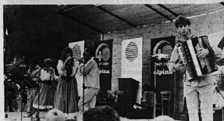
Za prijetno razpoloženje je igral ansambel RŽ