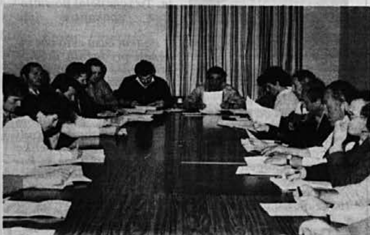
Udeležba delegatov na prvem zasedanju je bila zelo dobra. Upamo, da bo še naprej tako

Priljublja se tudi obnova regionalne ceste skozi Žiri in gradnja pločnikov.