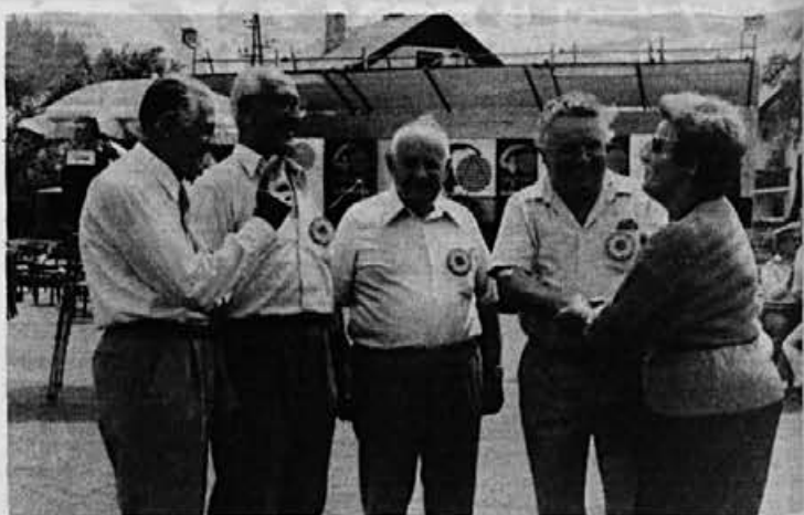
Srečanje veteranov naše trgovske mreže

Še enkrat čestítam vsem delavcem Alpine ob 40-letnici, vsem Žirovcem in ostalím pa še ob našem partizanskem prazniku – Dnevu borca.