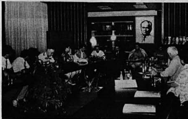
Pred kratkim je Alpino obiskala skupina naših poslovnih partnerjev iz Kanade.