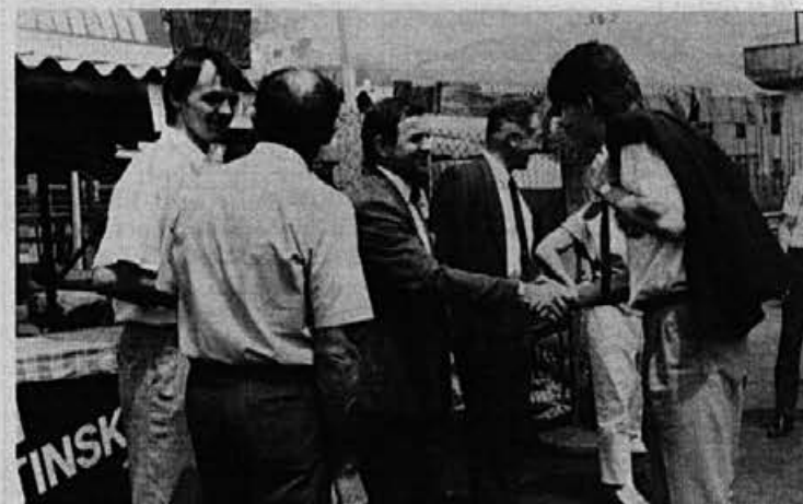
Prisrčno srečanje z gosti

Glasilno Delo-življenje praznuje letos 25-letnico delovanja. V vsem tem času je prispevalo velik delež k razreševanju težav v delovni organizaciji, pomagalo pri uresničevanju poslovnih ciljev Alpine ter se uveljavilo kot nepogrešljivo sredstvo obveščanja delavcev Alpine, je bilo rečeno v obrazložitvi k priznanju.