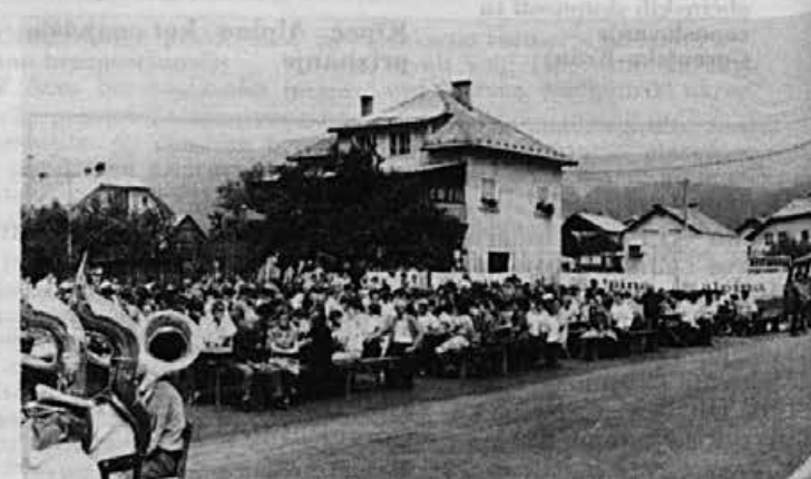
Bilo je veliko ljudi in veselo vzdušje