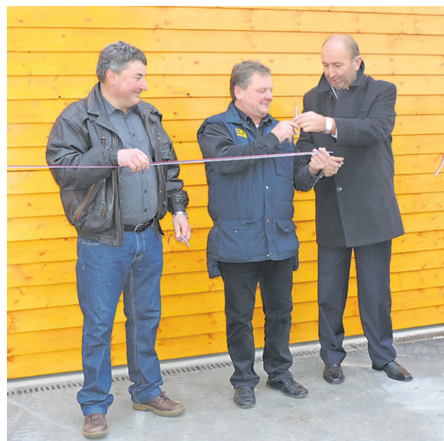
Zadovoljni obrazi ob slavnostnem prerezu traku novega skladišča