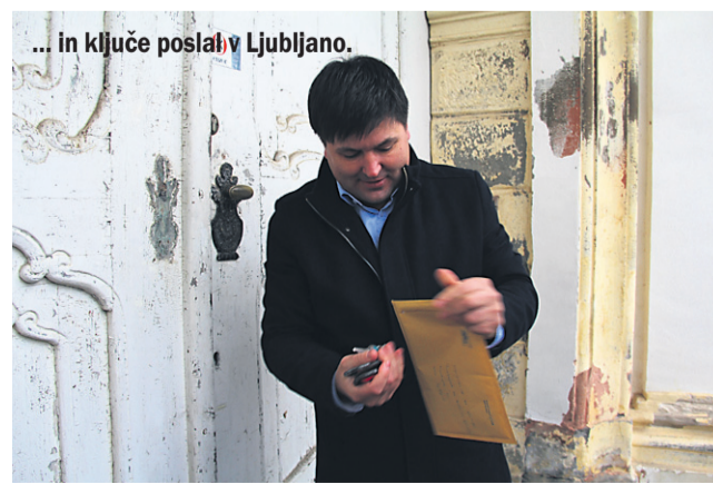
... in ključke poslal v Ljubljano.