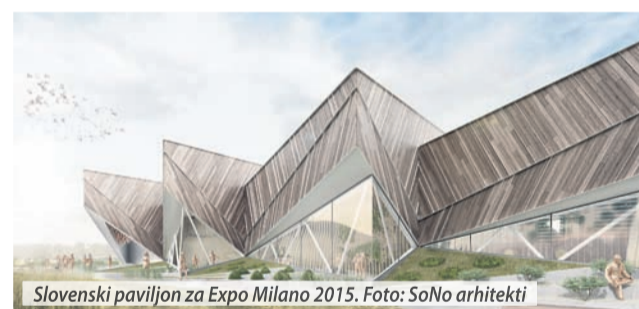
Slovenski paviljon za Expo Milano 2015.

Hiše Lumar predstavljajo kakovosten spoj odličnega dizajna, odlične arhitekture in najboljše tehnologije. S hišami danes prese-