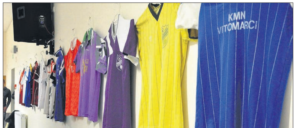
Zanimiva razstava dresov, ki so jih člani KMN Vitomarci nosili v vseh 30. letih.