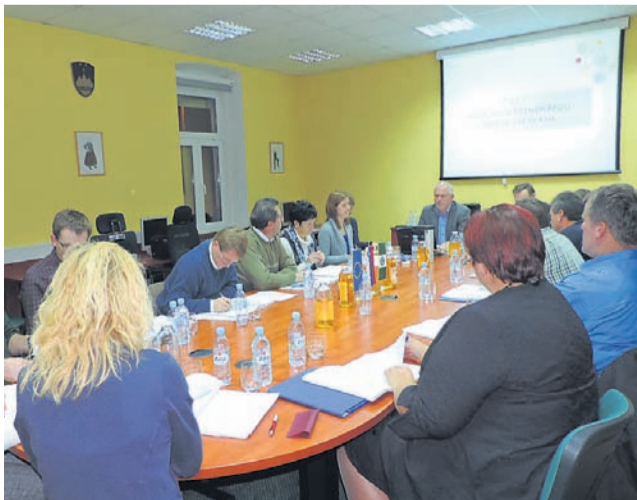
Občinski svet Sv. Ane je na minuli seji potrdil tudi več delovnih teles in komisij.