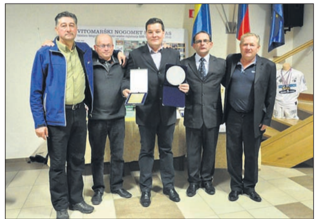
Najzaslužnejši posamezniki za razvoj KMN Vitomarci skozi čas.