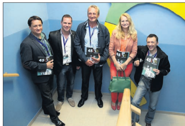
Strokovna komisija je imela letos težko delo: med skoraj izenačenimi ansambli izbrati najboljše.