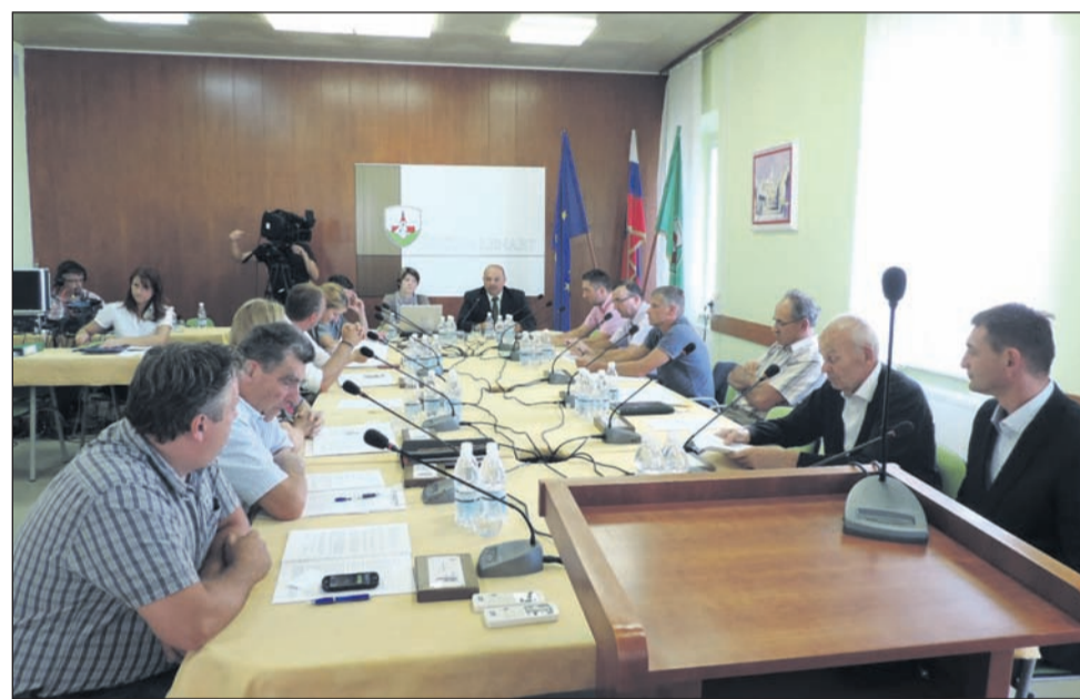
Člani sveta občine Lenart so na zadnji seji brez razprave sprejeli tudi Odlok o spremembah in dopolnitvah Odloka o prostorskih in ureditvenih pogojih (PUP) za mesto Lenart.