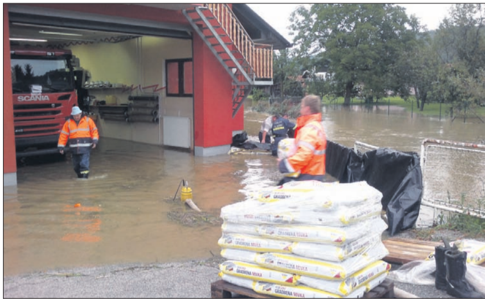
Zopet je poplavlilo gasilski dom – v garaži je bilo okrog 20 cm vode, v kurilnici in sanitarijah pa okrog 40 cm vode.