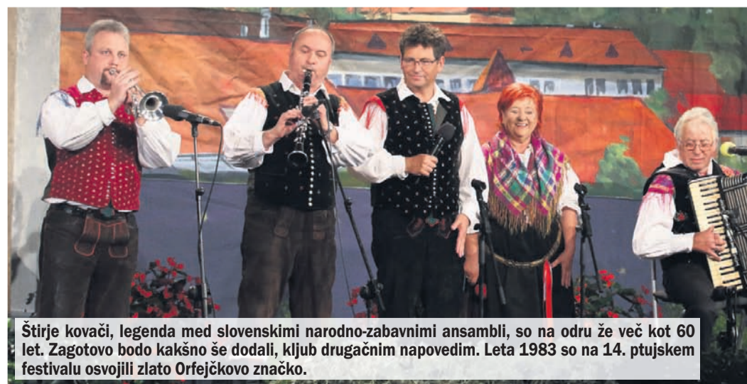
Štirje kovači, legenda med slovenskimi narodno-zabavnimi ansambli, so na odru že več kot 60 let. Zagotovo bodo kakšno še dodali, kljub drugačnim napovedim. Leta 1983 so na 14. ptujskem festivalu osvojili zlato Orfejkovo značko.