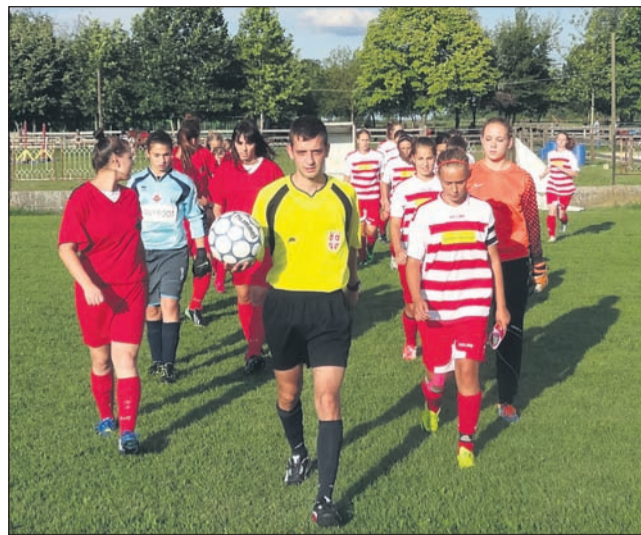
Ptujčanke so v Vojvodini navdušile.

»Dekleta so dva dni pošteno garale, tako dopoldan, kot popoldan. Tekme in treningi so se vrstili kot po tekočem traku. Izjemno sem zadovoljen z marljivostjo in pristopom, kar se je odražalo tudi na rezultatih, saj smo večina igrali s starejšimi kategorijami. Tudi v prostem času, čeprav ga ni bilo veliko, so punce pokazale, kako se tvori ekipni duh in prijateljstvo. Mislim, da smo dosegli to, kar smo si želeli. Hvala tudi vsem staršem, ki so si vzeli čas in