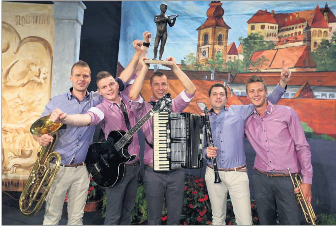
Ognjeni muzikanti so zmagali med kvinteti.

Kot je že od vsega začetka ptujskega festivala narodno-zabavne glasbe stalnica kakovost, je stalnica na neki način tudi vreme, saj ga je v 45 letih že večkrat pregnalo z osrednjega festivalskega prostora, dvorišča minoritskega samostana. Tudi letos so ga zaradi slabe napovedi morali preseliti v dvorano. Letos je bila gostiteljica športna dvorana OŠ Ljudski vrt, ki se je izkazala kot dobra festivalska kulisa. Dobrih tisoč dvesto obiskovalcev se tudi v novem okolju ni dalo zмести, bučno, na trenutke športno navijaško, je pozdravilo letošnje udeležence festivala.