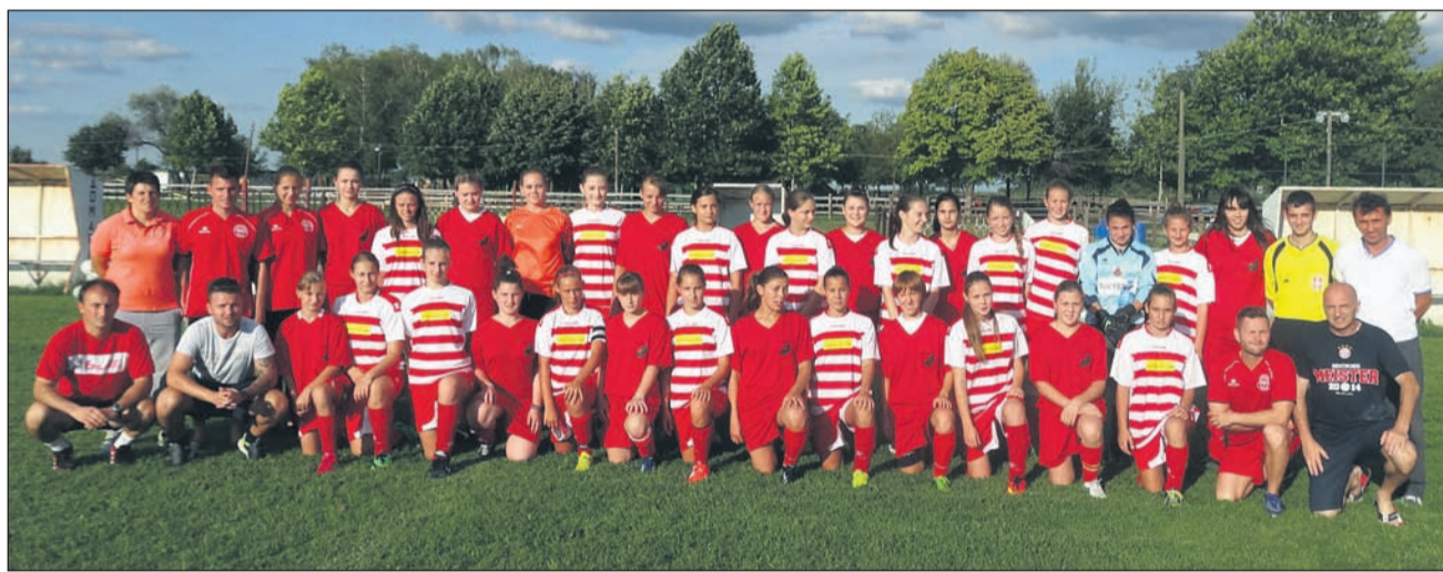
Skupinska fotografija pred tekmo z ekipo Radničkega iz Zrenjanina