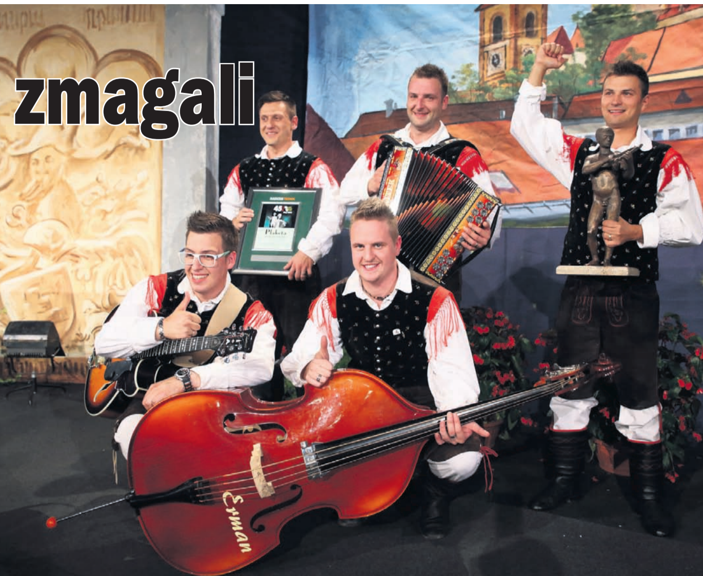
Ansambel Vikend je slavil med drugimi zasedbami.