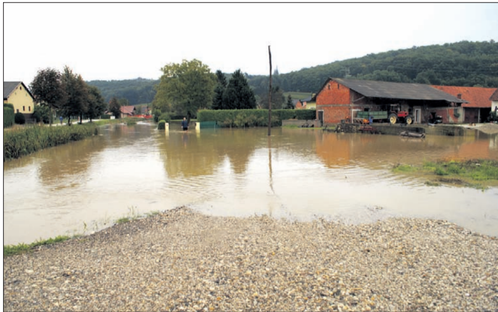
Voda iz potoka Krka v naselju Gabrnik je poplavlila dvorišča ter dovozne poti, zalila gospodarske objekte in mizarsko delavnico.