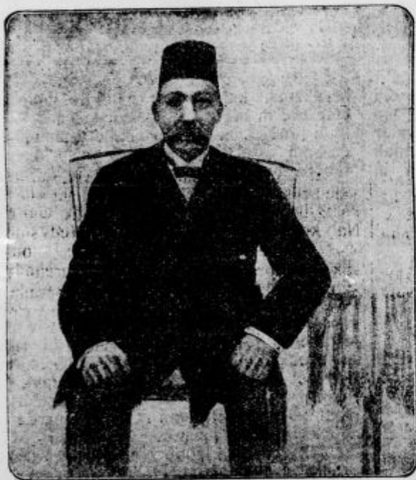
Sultan Mohamed V.

Samo eno osebno struno še uberem in sicer o našem dičnem načelniku dr. Šusteršiču. On nima od mene nič pričakovati in jaz od njega nič, drug od drugega sva popolnoma neodvisna in zato mislim da imam vso pravico, da izpregovorim nekaj o njegovi osebi. Sedaj, ko je stal v ospredju cele slovanske opozicije, sedi smo videli čudno prikazen, o kakršni smo nekaj čitali v knjigah na gimnazijski klopih. Mi smo čitali o Cezariju in prijateljih njegovih. Ti so prihajali k njemu se gostili, približevali in bili prijazni njim, toda za hrbtom so imeli skrčene roke in v njih morilno orodje in ti so ga tudi res umorili. Njegov najboljši prijatelj mu je zadal smrtni udarec. Nekaj takega smo videli tudi v zadnjem času. Ko je naš načelnik stal v ospredju in bil voditelj vseh slovanskih protivladnih strank, videli smo, da so nekateri prijatelji hodili