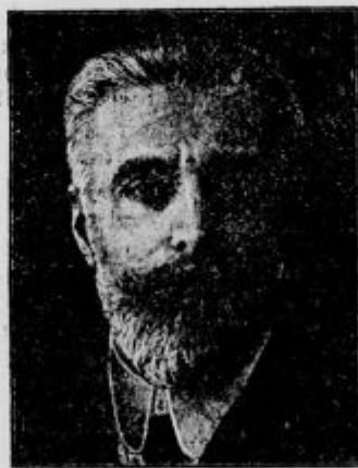
Ahmed Riza novi veliki vezir, mladoturški vodja.

pan. Kaj se to pravi? Kdor nima z deskami obite glave, bo vedel, da moramo, ko smo enkrat kaj takega sklenili, tudi nekaj storiti, da se sklep izvrši in da vlada res ne dobi ničesar več. (Tako je!)