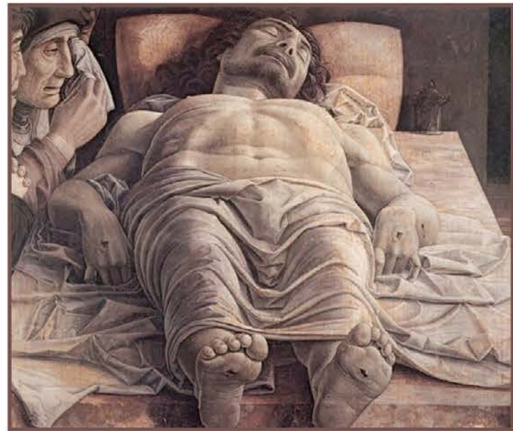
Beseda mora stopiti na dan z vsem spoštovanjem in odločnostjo.

govorica, ki je mogla ubesediti večno Besedo Boga za najvišji življenjski smisel! Toda, ko je prišla, smo jo utišali, da nam je morala v tišini spregovoriti s svojo ljubeznijo. Skoraj vse upodobitve križa prikazujejo mrtvega Jezusa, v katerem je pogan, rimski stotnik, začutil bližino Božje ljubezni in ga prepoznal za Božjega Sina.