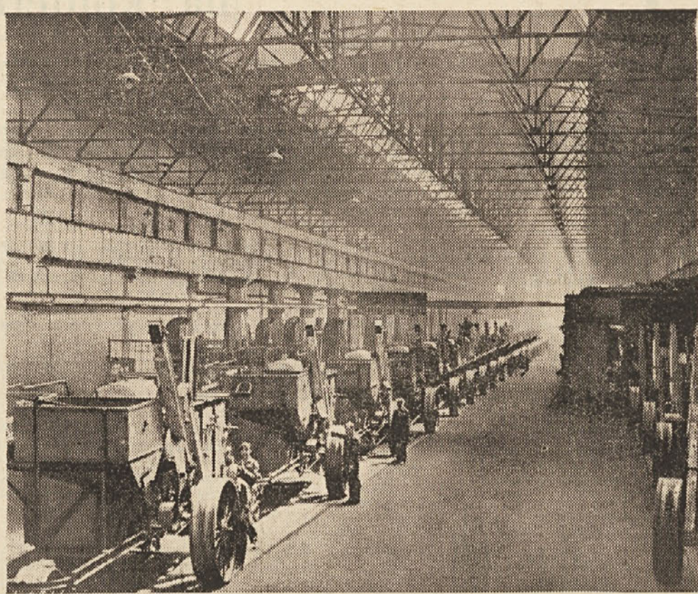
Nov, najmodernejši način obdelovanja polja zahteva najrazličnejše moderne stroje in traktorje. Sovjetska oblast polaga veliko pozornost mehanizaciji pri obdelovanju polj.