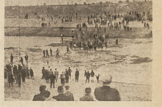
Množice pozdravljajo otvoritev novega kanala Volga-Don. Voda si osvaja novozgrajeno strugo Voda zaliva novo strugo.