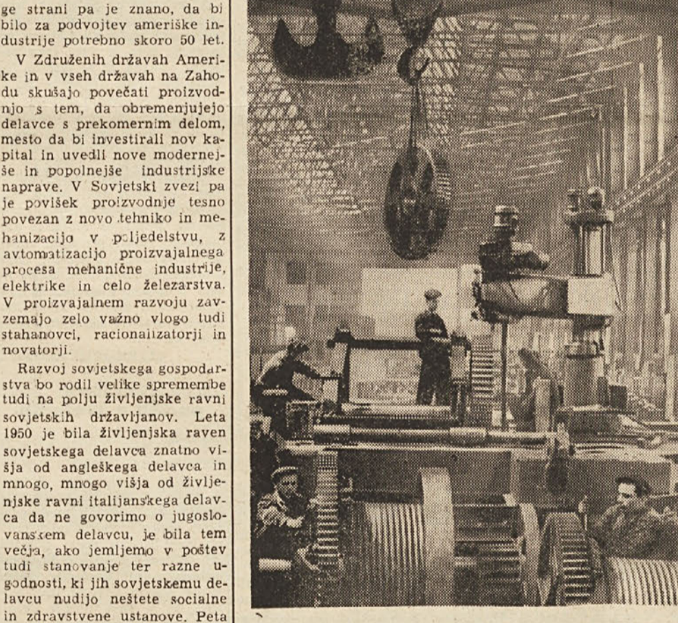
Mehanična delavnica «Stalino» v Kramatorsku v Doneckem bazenu