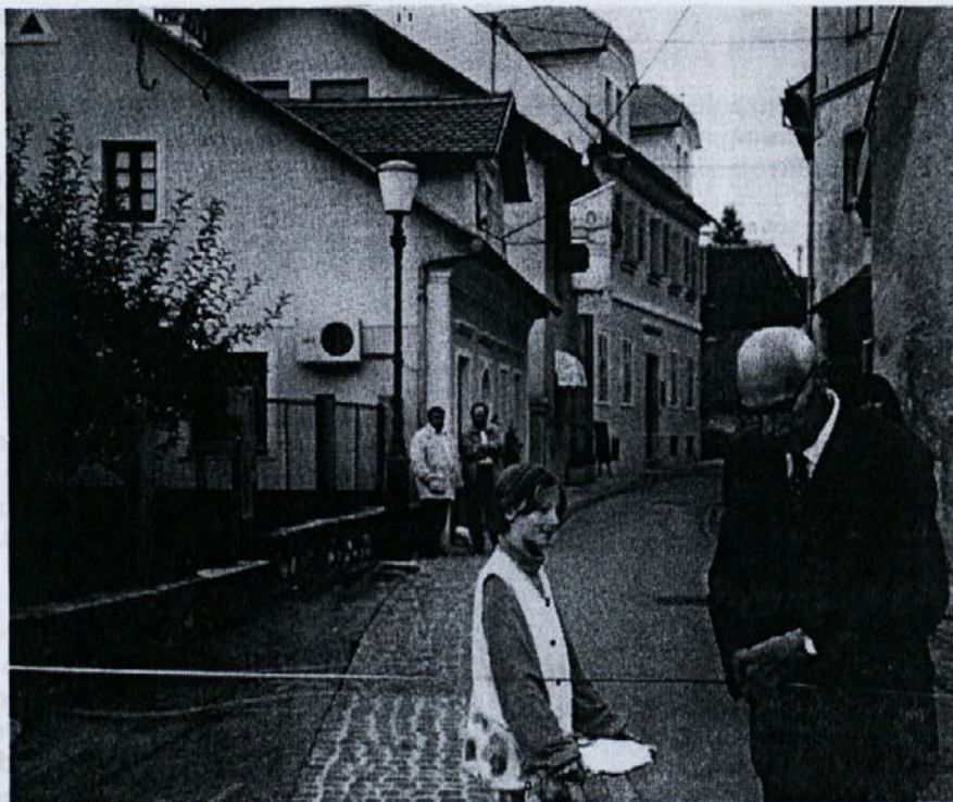
Ob otvoritvi Vrhovčeve ulice.

Vas starostnike si upamo prositi, da nam preko aktivistk ali pisno v naš predal pri KS Center sporočite vaše želje in potrebe po kakršnikoli sosedski pomoči: pospravljanje stanovanja, pomoč pri pranju perila, priprava kurjave, nabave ali pa samo za prijeten klepet. Mi bomo poskrbeli za ustrezno osebnost in jo napotili k vam. Če imate telefon nam to lahko sporočite vsak dan med 8. in 10. uro na telefon: 321-009 ali popoldne na telefon: 25-974.