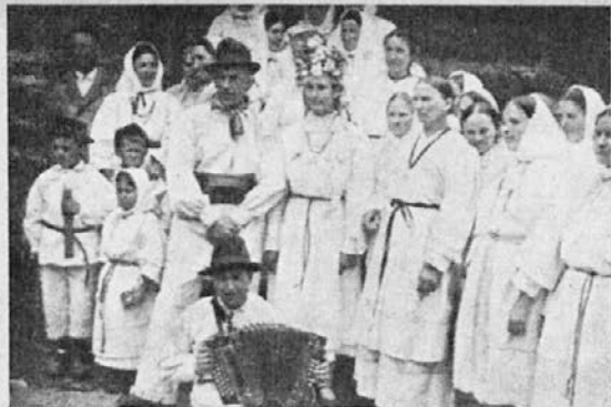
Belokrajinsko svatovanje na Vinici

našel v enem teh grobov. Ta novec izvira iz leta 83. pred Kristusovim rojstvom in ga je dal kovati takratni konzul C. Norbanus. Med drugimi izkopaninami naj omenim tudi najdbo fibule (zaponke) z okraski.