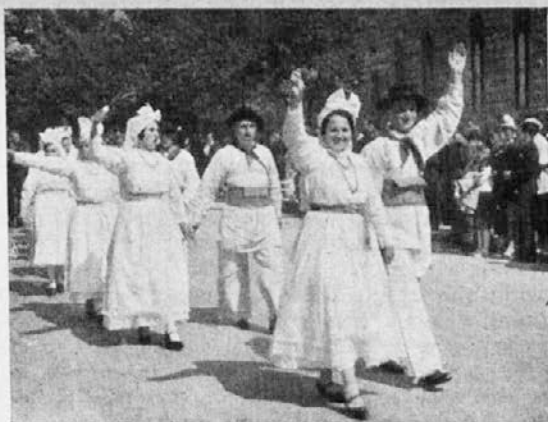
Sprevod Belokrajincev v Ljubljani